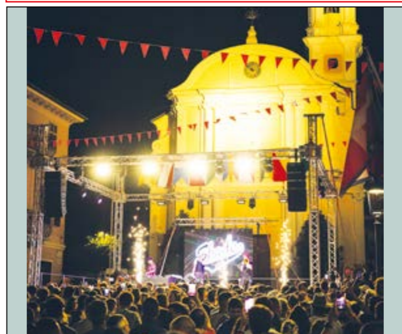
Shade: un big tra i giovani...

Vice Sindaco con delega alle Manifestazioni