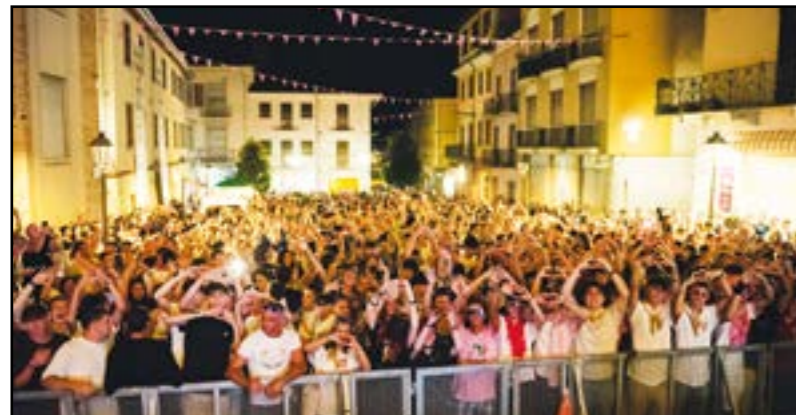
Popolo della notte...