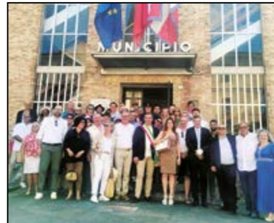
Il Gruppo dei Gemellati anno 2023

Nella mattinata, piazza Europa ha ospitato il ritrovo dei mezzi agricoli che poi hanno proseguito in corteo in un percorso cittadino sino a raggiungere il sagrato della chiesa parrocchiale. Qui ha avuto luogo la S. Messa delle ore 11,15, coronata all'uscita con la benedizione dei mezzi. Infine, il tradizionale pranzo al ristorante "Belavista" nella borgata Madonna dei Cavalli. P.D.