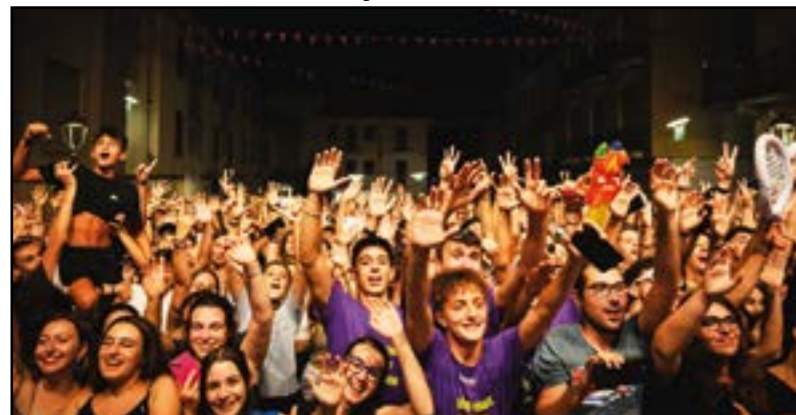
Facce da Fiera...