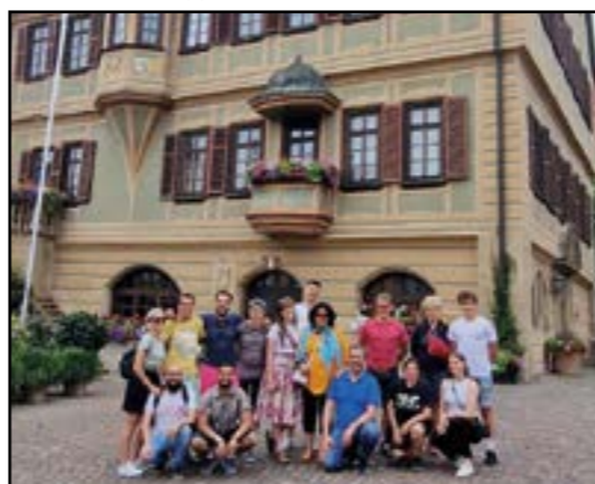
Canalesi in trasferta a Sersheim