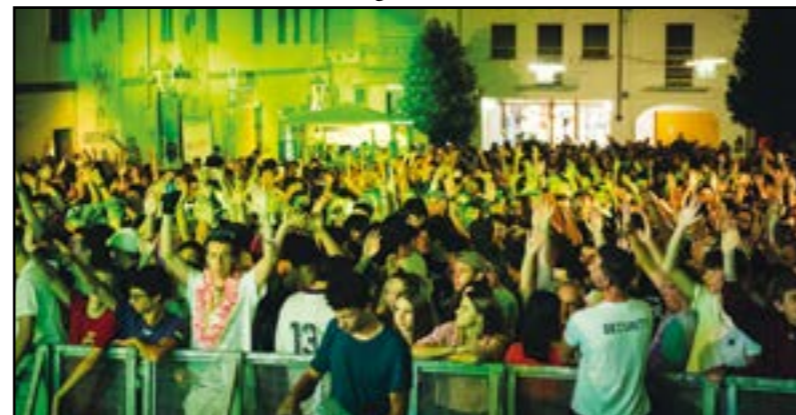
Tanta musica.. tanta festa...