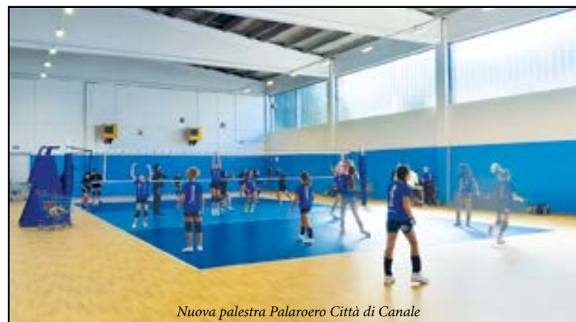
Nuova palestra Palaroero Città di Canale