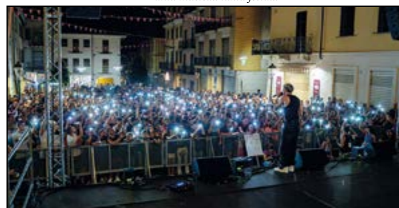
Giochi di luci...