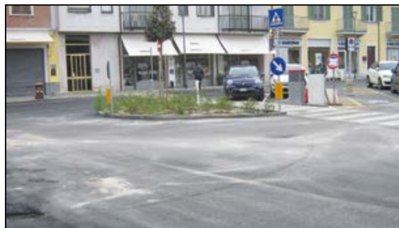
Piazza Trento Trieste: lavori ultimati

L'opera è pressoché completata; rimane da ultimare una minima porzione lungo Via Mombirone, attualmente in fase di realizzazione dopo i lavori di manutenzione su un tratto di acquedotto realizzati dall'Egea acque.