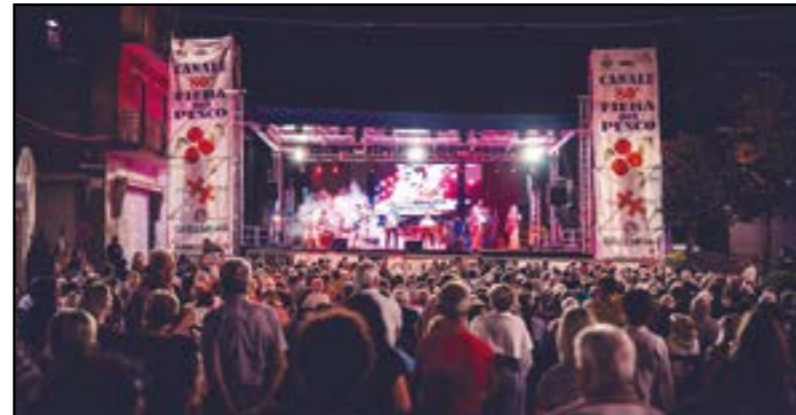
Bagutti: liscio non ti lascio...