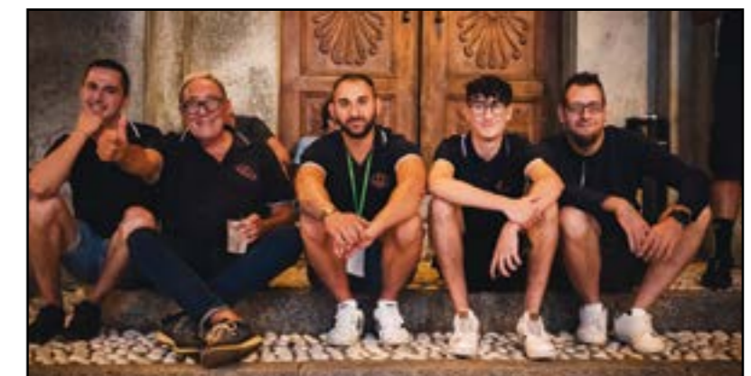
I magnifici Cinque...