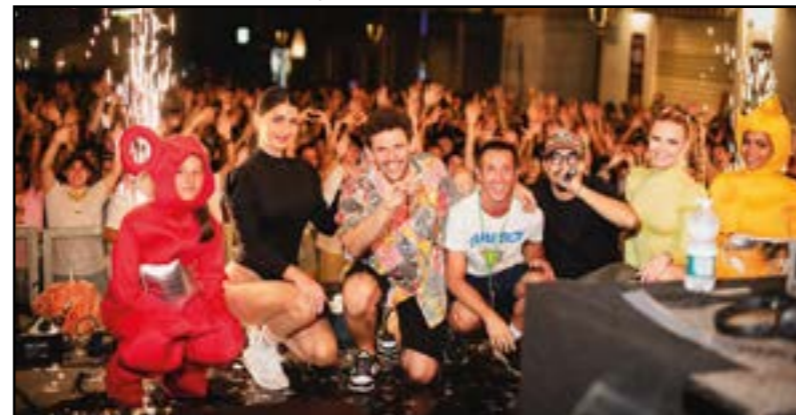
I meravigliosi Anni 90...