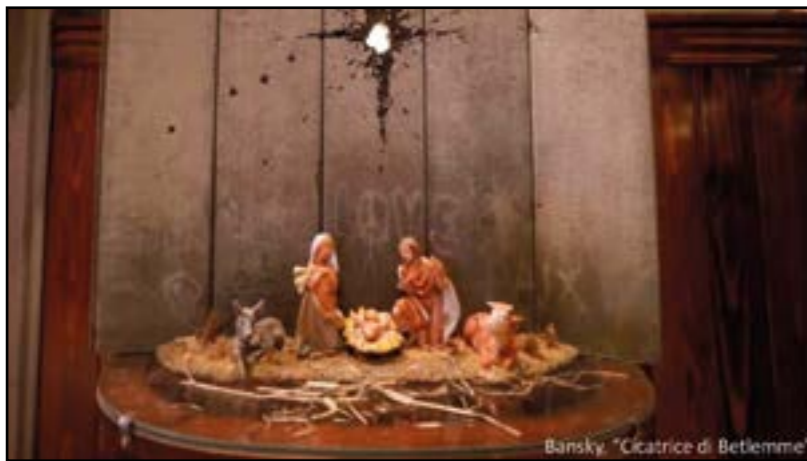
Bansky "Cicatrice di Betlemme"

Il presepe, nato dalla mente di san Francesco d'Assisi che lo allestì per la prima volta a Greccio nel 1223, compie 800 anni. Maria "diede alla luce il suo figlio primogenito, lo avvolse in fasce e lo pose nella mangiatoia, perché non c'era posto per loro nell'alloggio" (Lc 2,7) Ecco l'essenziale del racconto del Natale: Gesù nasce e viene deposto da Maria in una mangiatoia, che in latino si dice praesepe, da cui presepe.