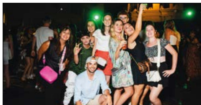
La Bella Gioventù...