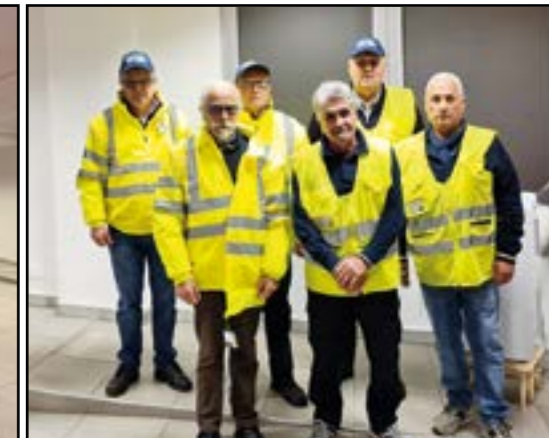
I Nonni Vigili