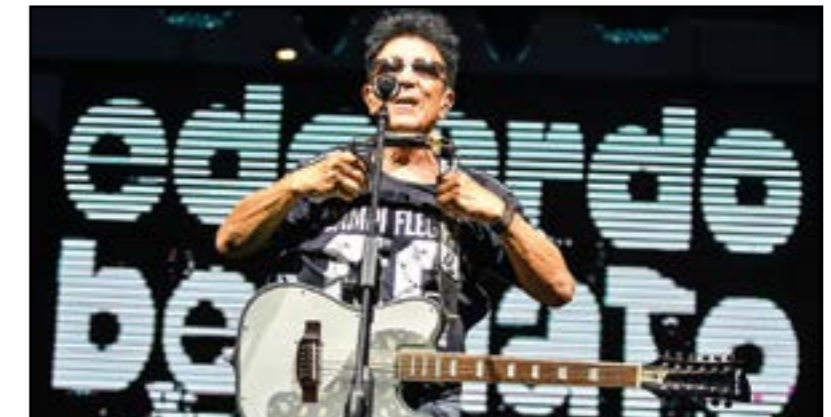
Edoardo Bennato: un grande!