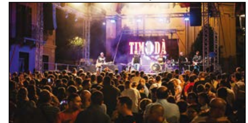
Timodà: tanta bella musica...