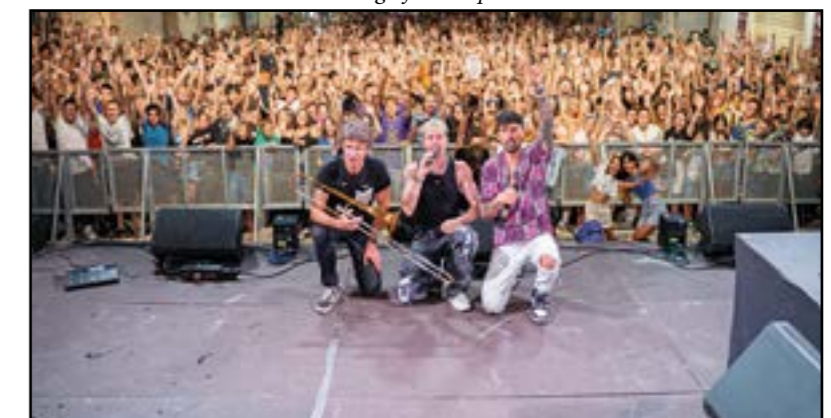
Musica e tanta bella gente...