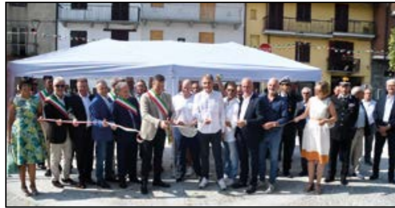
Inaugurazione della Piazza Trento e Trieste