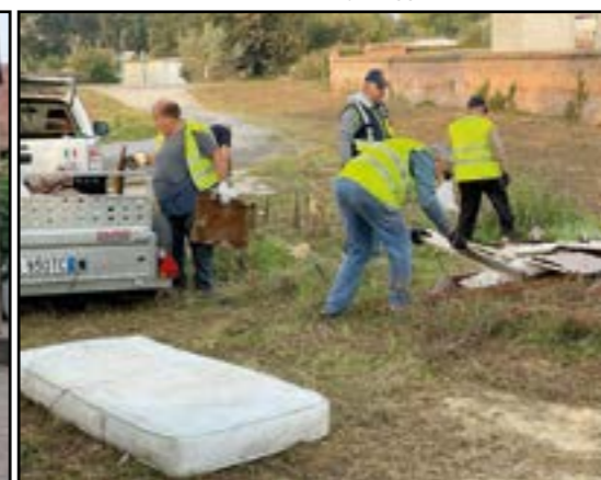
Protezione Civile all'opera