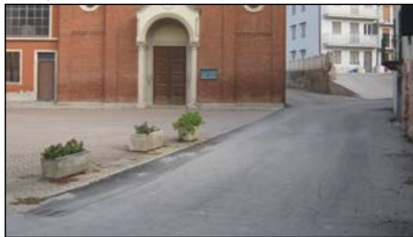
Madonna dei Cavalli: Ripristino manto stradale

L'ammontare consuntivo delle suddette opere stradali ammonta a circa 240.000,00 euro.