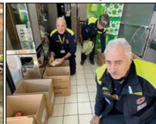
Raccolta "Banco Alimentare"