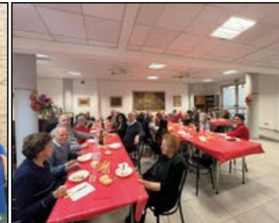
Il Circolo Pensionati festeggia...