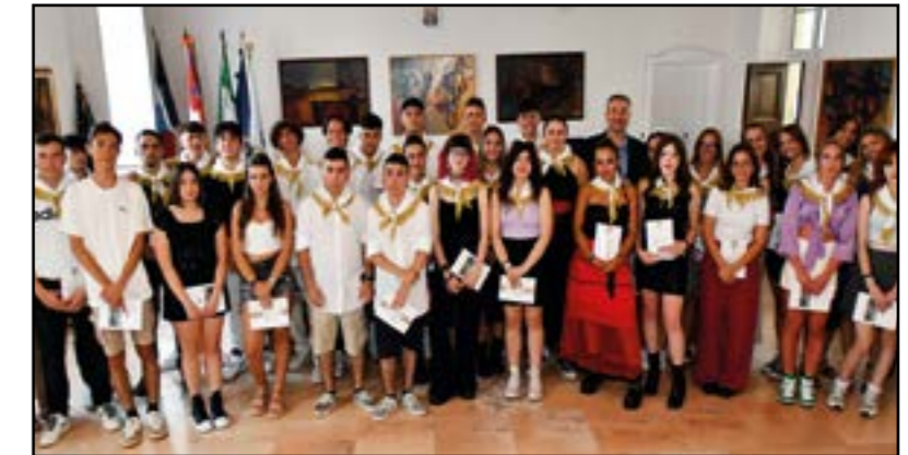
Ai Neodiciotenni: la nostra Costituzione...