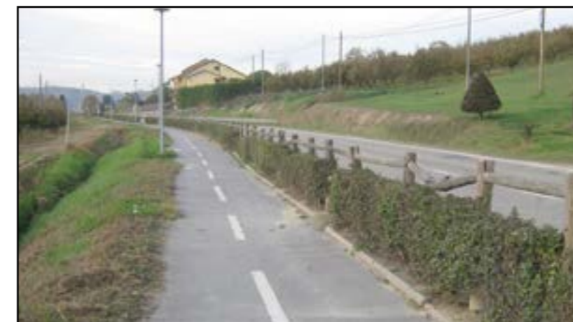
Pista Ciclabile Canale - Valpone

L'intervento è stato realizzato nel mese di ottobre.