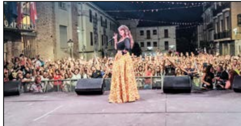
Cristina D'Avena: l'intramontabile!