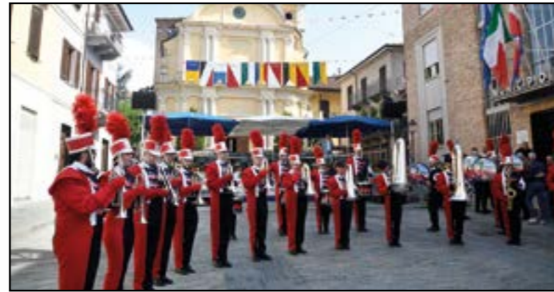
La Banda suona...