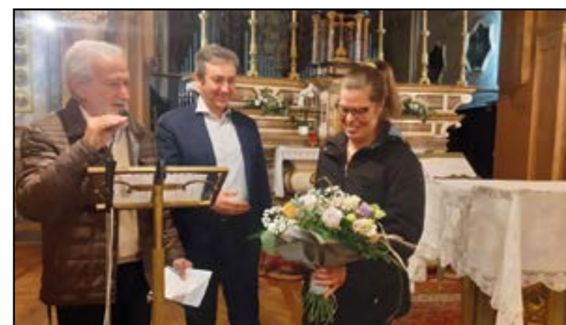
Inaugurazione della Cappella del Rosario restaurata