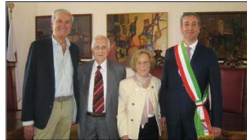
La coppia con 60 anni di matrimonio

Nella festa della S.S. Trinità, domenica 4 giugno scorso, presso la parrocchia San Vittore di Canale, 34 coppie hanno celebrato l'anniversario della loro unione.