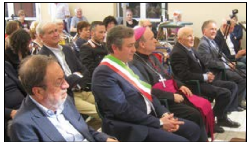
Le autorità presenti