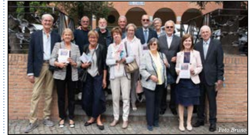
Le coppie con 45 anni di matrimonio