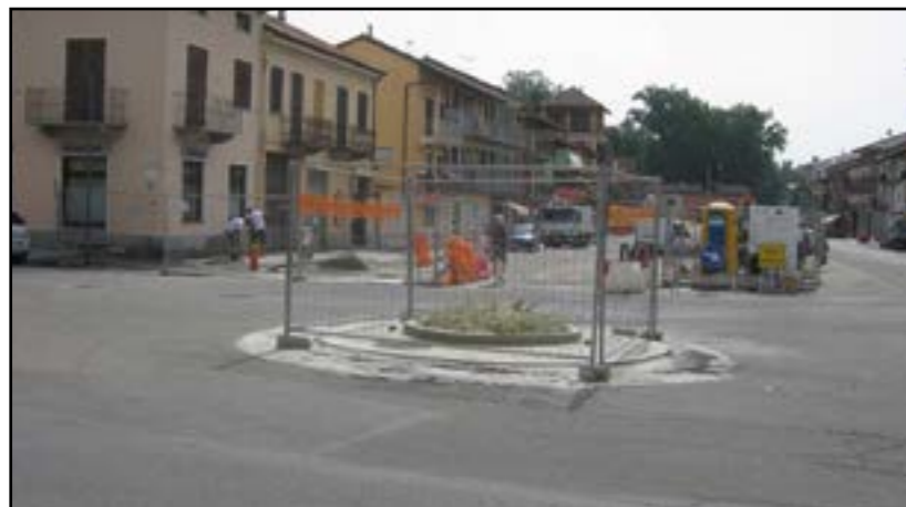
Lavori in corso