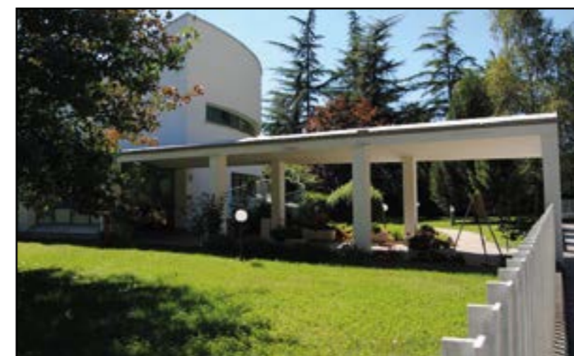
Asilo "Regina Margherita"

2) - opere di adeguamento dell'impianto illuminazione, con tecnologia a led. L'opera è stata appaltata ed i lavori avranno inizio a breve, con previsione di ultimazione nel periodo estivo.