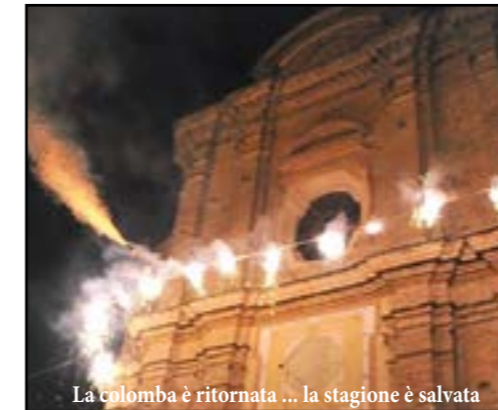
La colomba è ritornata ... la stagione è salvata

Proprio in previsione delle funzioni natalizie, per migliorare la resa acustica dell'impianto di amplificazione della chiesa, oramai datato, si è reso necessario l'acquisto di un paio di nuovi microfoni.