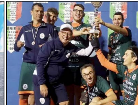
Pallapugno: Coppa Italia