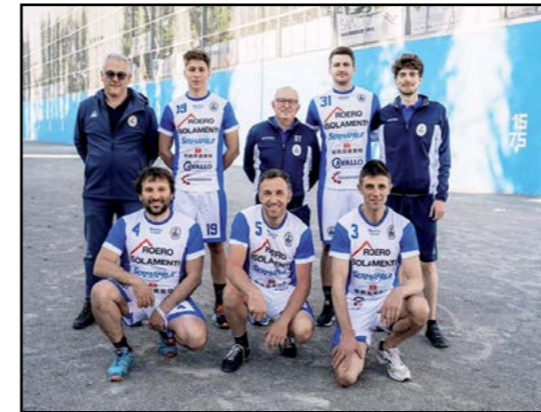
Pallapugno Serie A

Periodico patrocinato da Gruppo Egea - Alba.