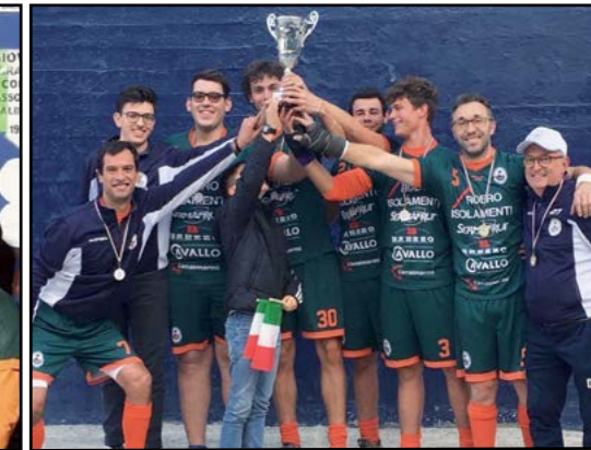
Pallapugno: Campionato Serie C