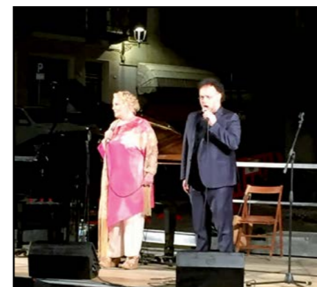
Serata in musica con Katia Ricciarelli

Vice Sindaco con delega alle manifestazioni