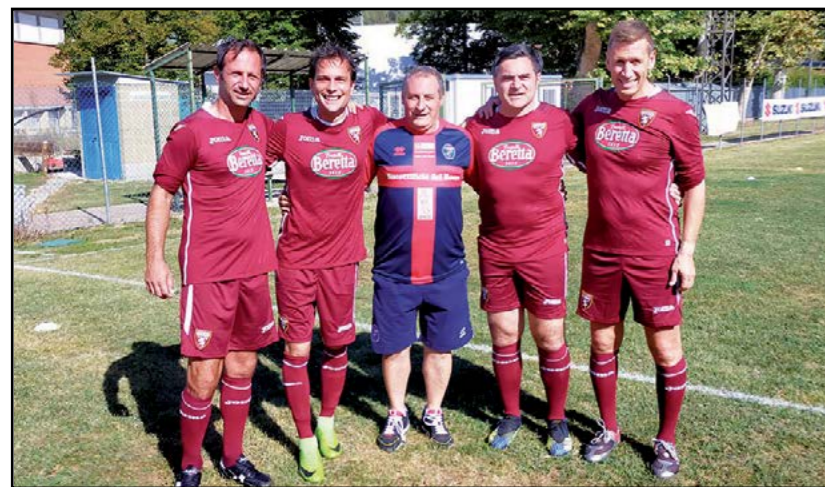
"La partita più bella del mondo" con ex giocatori del Torino

Finalmente torniamo a parlare del Natale in una situazione di quasi normalità, quella normalità che sembra essere il più bel regalo che tutti noi possiamo chiedere.