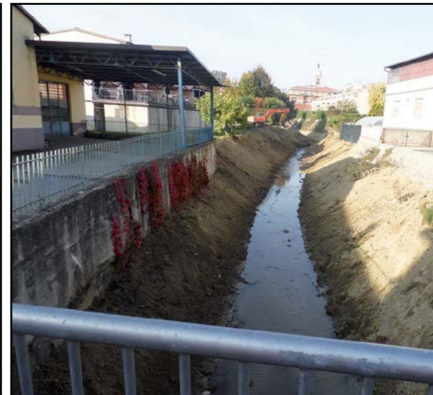
Manutenzione Rio di Canale