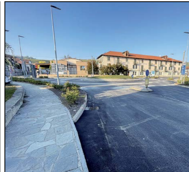
Rifacimento manto stradale Corso Alba