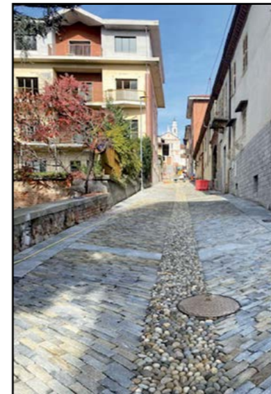
Lavori di Via Melica