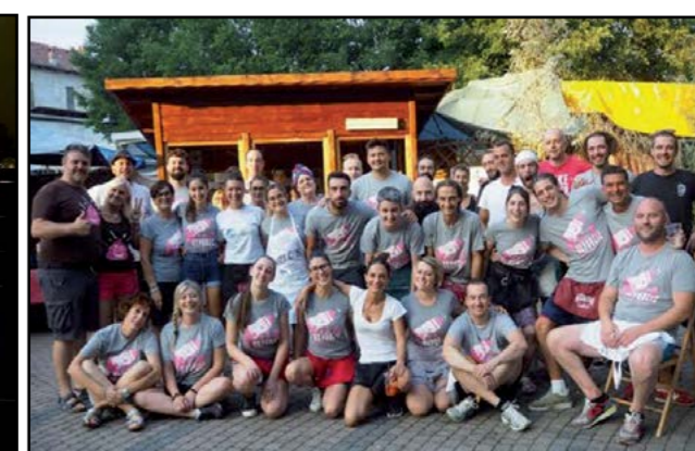
Gruppo Ostu der Masche