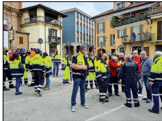
Meeting in Piazza San Bernardino