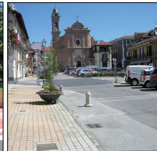
Piazza San Bernardino