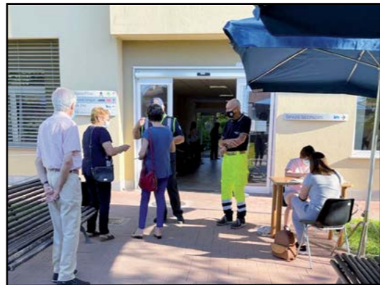
Volontari per il Centro vaccinazione

Le sfide che questa prima parte del 2021 ci ha posto di fronte sono state ardue, ma la nostra comunità ha saputo affrontarle e vincerle grazie soprattutto alla capacità ed alla determinazione delle nostre molteplici associazioni di volontariato.