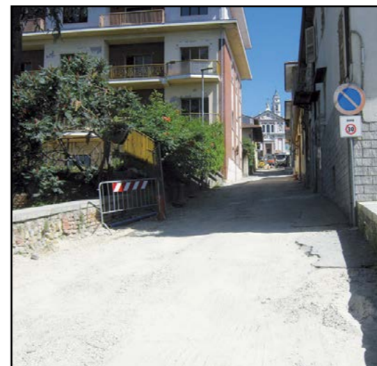
Lavori in corso Via Melica