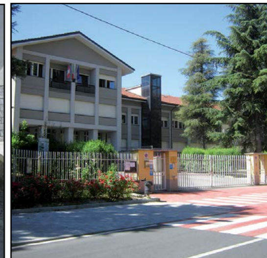
Istituto Scolastico Comprensivo