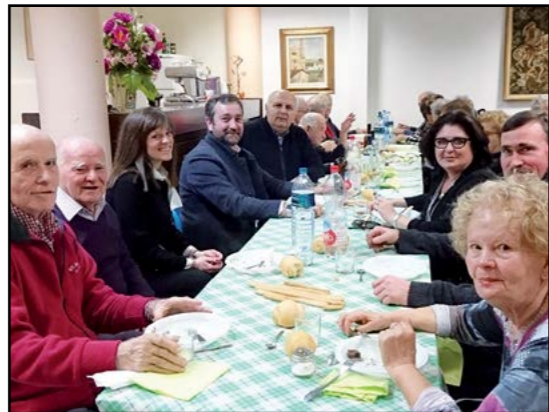
Un convivio "Antan" al Centro Anziani