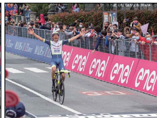
La felicità del vincitore di tappa