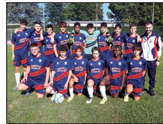
Calcio Allievi 2004-2005

Alla luce delle recenti disposizioni normative legate all'emergenza sanitaria in atto che vietano lo svolgimento di Fiere e Mercati su tutto il territorio nazionale, L'Amministrazione Comunale e l'Ente Fiera del Pesco hanno deciso di annullare i Mercatini di Natale previsti nelle giornate del 6, 13 e 20 Dicembre 2020.