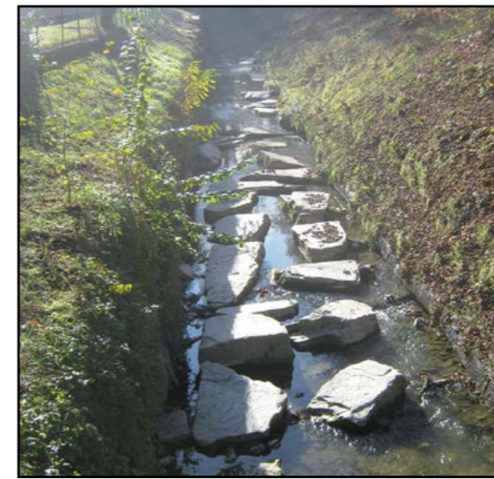
Sistemazione Rio di Canale

I tratti in questione sono stati oggetto di asfaltatura diversi decenni orsono. Ora la superficie stradale - anche a causa degli eventi citati e delle tracce relative al passaggio nel tempo di opere di rifacimento di numerosi sottoservizi - risultava degradata, sconnessa con conseguente pericolosità per il transito. In alcune porzioni stradali si è operato, inoltre, con interventi di