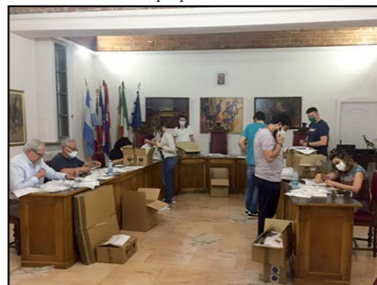
Volontari per la consegna dispositivi protezione individuale

Giunti in prossimità del termine di questo sventurato anno 2020, abbiamo la riprova (se mai ve ne fosse stato bisogno) che la nostra Città è dotata di un patrimonio umano immenso: si tratta di tutte le nostre Associazioni di volontariato, cuore pulsante della comunità che, attive sui fronti più svariati, non perdono occasione per donare i propri preziosi servizi ai concittadini.