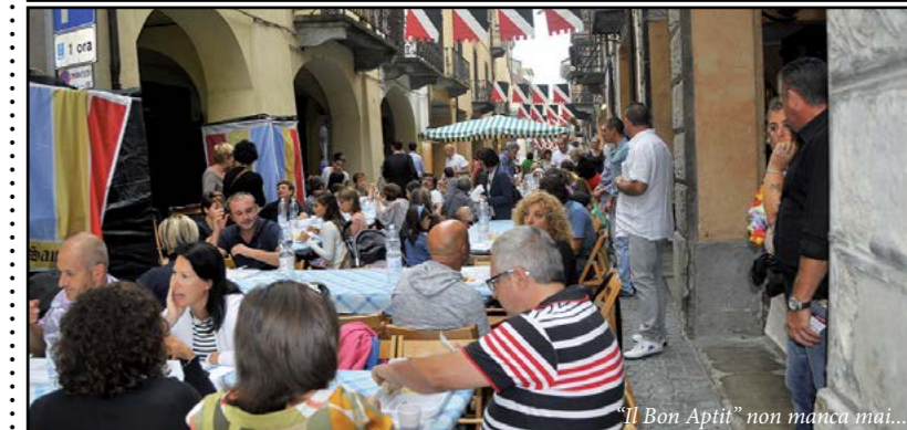
"Il Bon Apit" non manca mai...