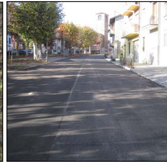
I lavori in Piazza Bernardi