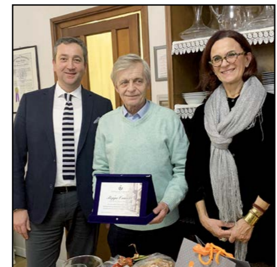
competenza a disposizione dei nostri uffici. Grazie ancora e naturalmente... e buona pensione.