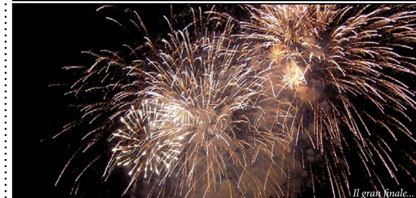
Il gran finale...