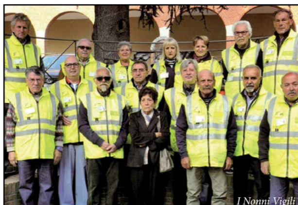
I Nonni Vigili