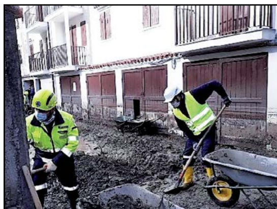
Protezione Civile per alluvione Limone-Ceva