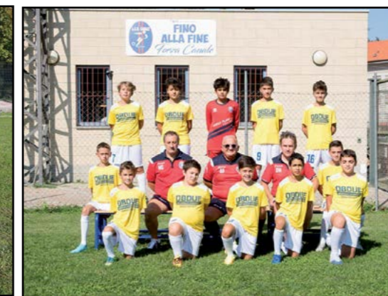
Calcio Esordienti 2009