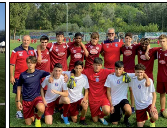
Calcio Open Day con Stefano Tacconi