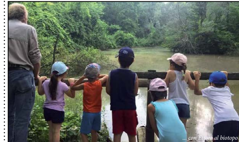
... con Letture al biotopo

Non da ultimo, l'esperienza di camminare nella natura, sperimentando la propria resistenza e forza di volontà su distanze lunghe seppur adeguate all'età dei bambini.