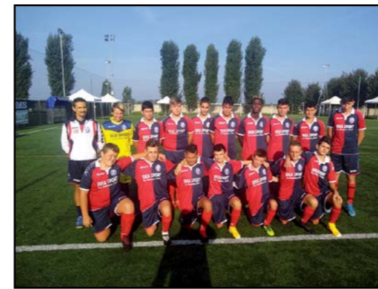
Calcio Giovanissimi 2006