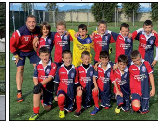
Calcio Pulcini 2011