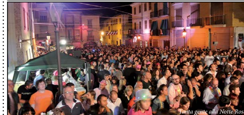
Tanta gente alla Notte Rosa