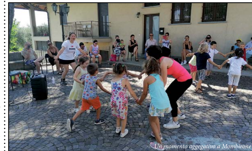
Un momento aggregativo a Mombirone

24 giugno: "Cercatori di tracce" nell'Oasi Naturalistica di San Nicolao; 1 Luglio: "Botanici - Alberi" al biotopo delle Rocche, sul Sentiero del Castagno: riconoscimento delle varie specie arboree presenti nell'ambiente naturale del Roero; 8 Luglio: "Esploratori" - visita all'interessante Museo naturalistico del Roero di Vezza d'Alba e passeggiata sul Sentiero del Trifolao e al laghetto ricoperto di fiori di loto; 15 Luglio: "Folkloristi" - al Sacro Monte dei Piloni di Montà, sulle tracce della religiosità popolare;