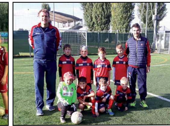
Calcio Primi calci 2013