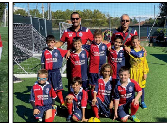
Calcio Pulcini 2012