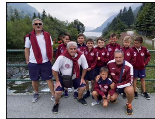
Calcio Pulcini 2010