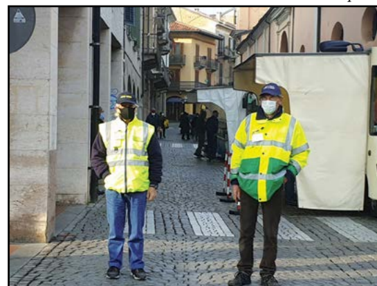
Nonni Vigili: Servizio al mercato