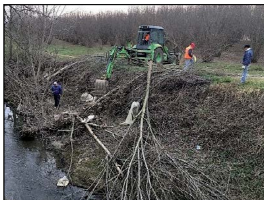
Protezione Civile per pulizia alvei Torrente Borbore