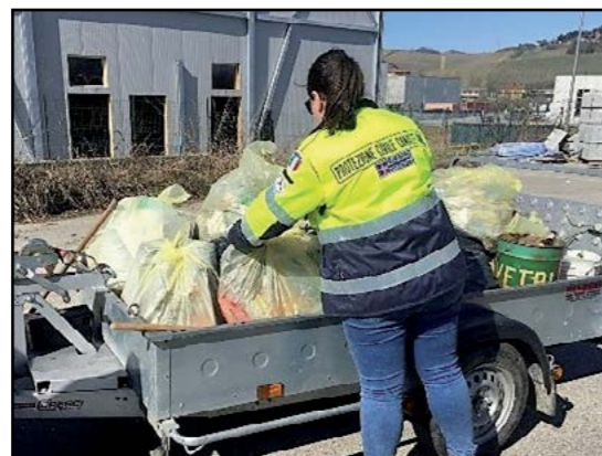
Pulizia fossi e rimozione materiali ingombranti