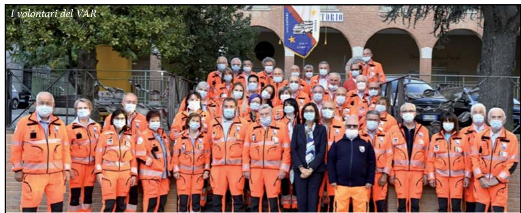
I volontari del VAR