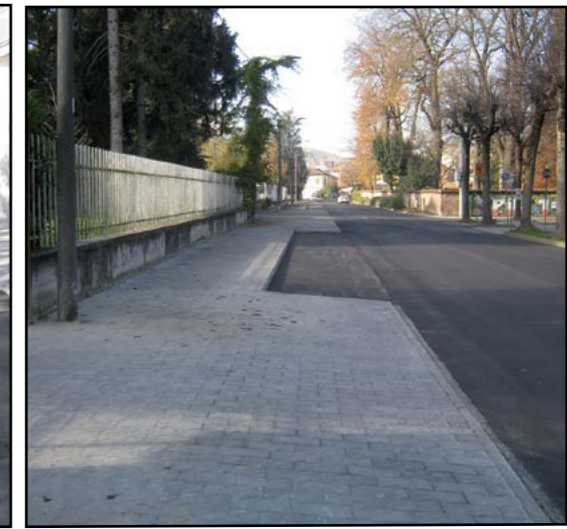
I lavori in Viale del Pesco

allargamento della massicciata utili, in particolare, per agevolare il transito di mezzi pesanti e/o di mezzi agricoli.