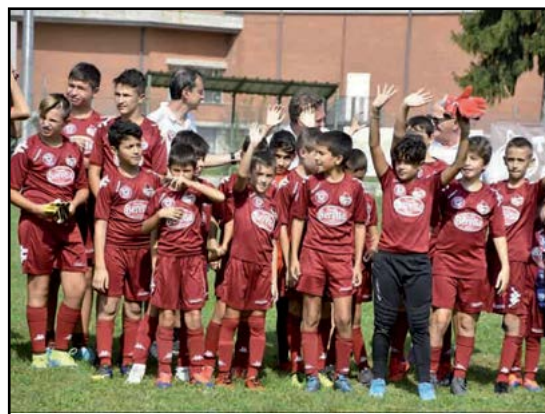
Piccoli del 2009