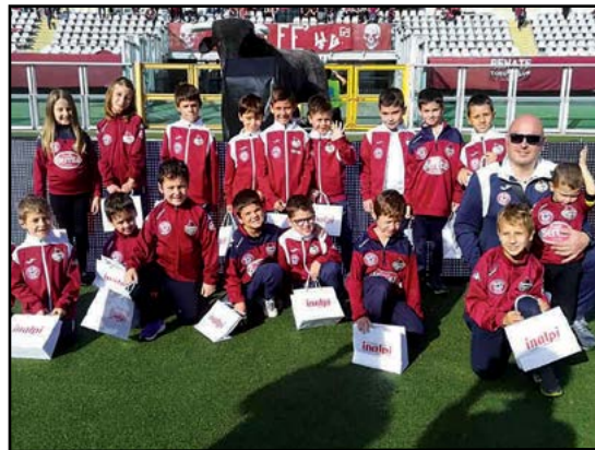
Bambini allo stadio del Grande Torino