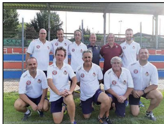
I nostri solerti Mister...

Come ogni anno è iniziata una nuova stagione calcistica nel Canale calcio, con molto successo, sia nei numeri di iscritti "sempre in aumento", sia nei risultati.