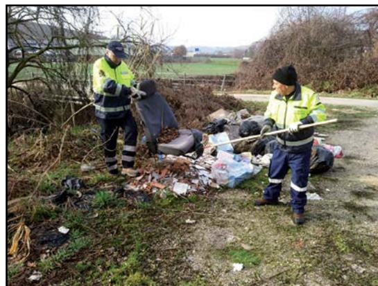
Pulizia Rifiuti anomali