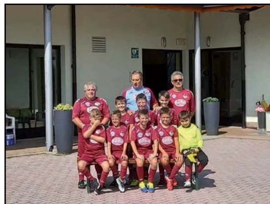
In trasferta a Sampeyre...