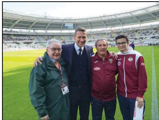
Uno scatto con i Dirigenti del Torino Calcio