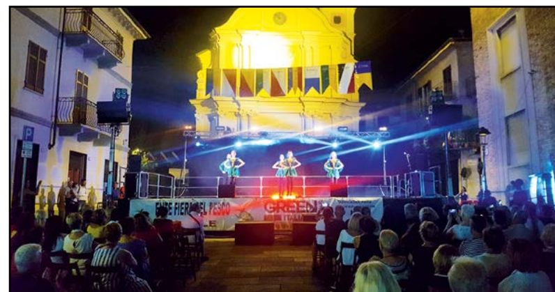
Melodie e Danze d'Irlanda...