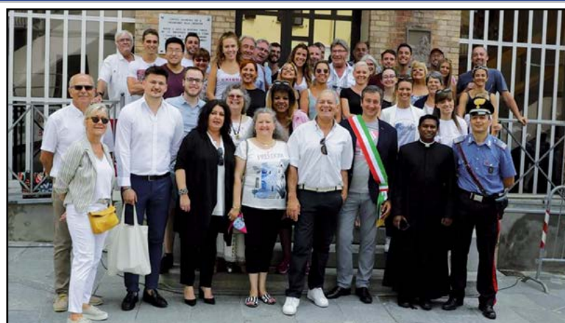
Fiera del Pesco 2019 con gli amici di Rodilhan

Innanzitutto un saluto a tutti i Canalesi e amici gemellati che hanno partecipato a tutte le attività di quest'anno.