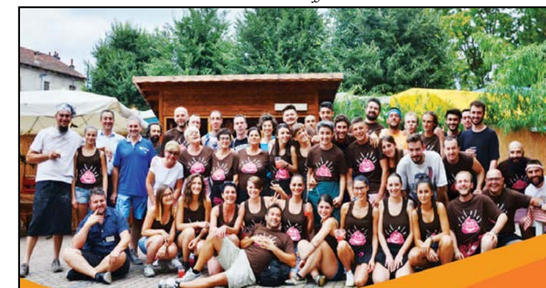
I ragazzi del Punto Enogastronomico.