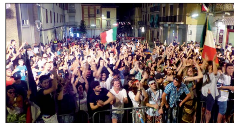
Decaleva in festa...