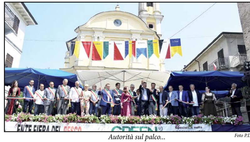
Autorità sul palco...