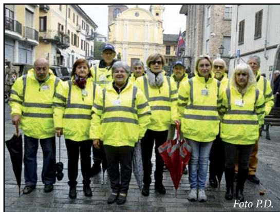
Volontari Ass. "Viva i Nonni"

Siamo quasi giunti al termine dell'anno 2019 e come negli anni precedenti possiamo riconoscere che tutte le nostre Associazioni di volontariato hanno donato alla nostra comunità una serie considerevole di servizi, operando in modo lodevole e soddisfacente, portando benefici preziosi ai nostri cittadini ed aiutando e supportando i nostri tecnici comunali nel loro lavoro.