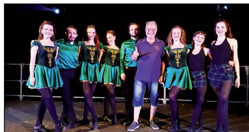
Il primo ballerino...