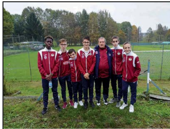
I selezionati dal Torino Calcio