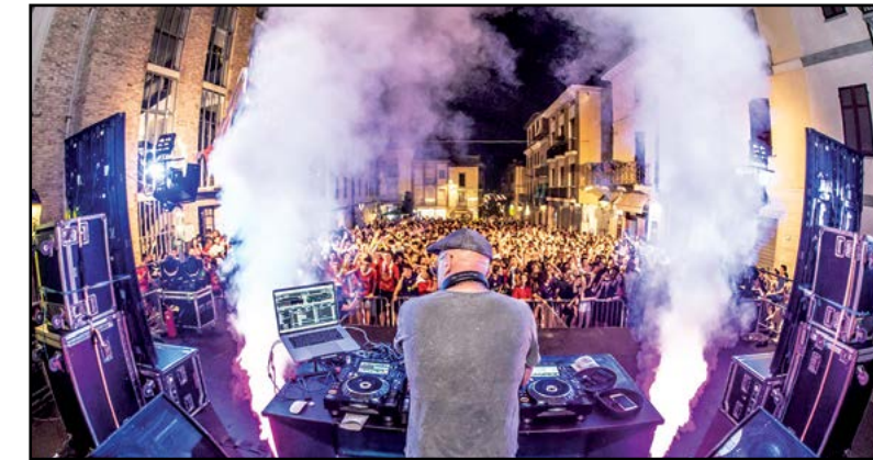
DJ in consolle...