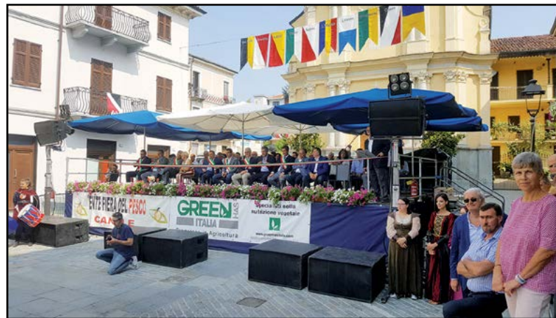
Pronti per l'inizio...