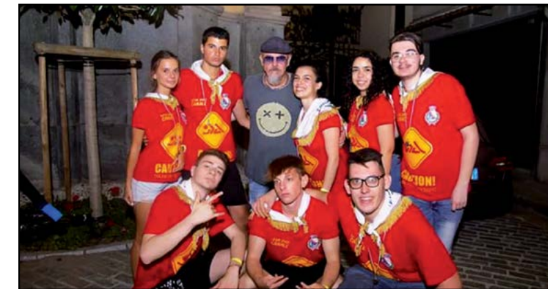
La Leva incontra il DJ...