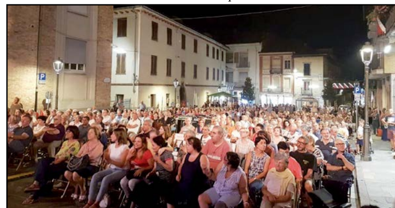
Concerto con i "Formula 3"...

Un rinnovato appuntamento con la tipica bevanda bavarese: "Ein prosit". L'evento ispirato al celebre "Oktoberfest" di Monaco di Baviera si è svolto nelle serate di venerdì 22 e sabato 23 novembre al Palagiovani di via Ternavasio (vedi foto). Due serate con buona partecipazione di pubblico, dove si sono gustate in allegria le specialità della Baviera e con l'intrattenimento musicale proposto dalla band "Die Gibnier Musikanten". Un'Ente Fiera con tanti giovani pronti ai prossimi appuntamenti festaioli.