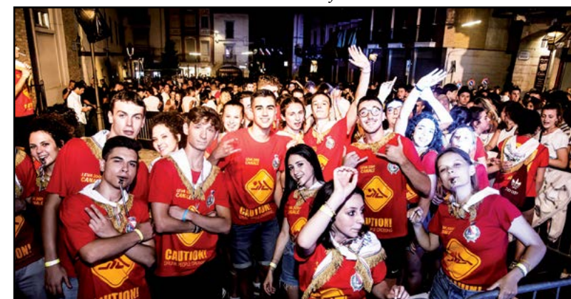
I diciottenni festeggiano...