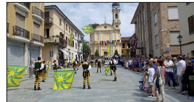
Gli sbandieratori in azione