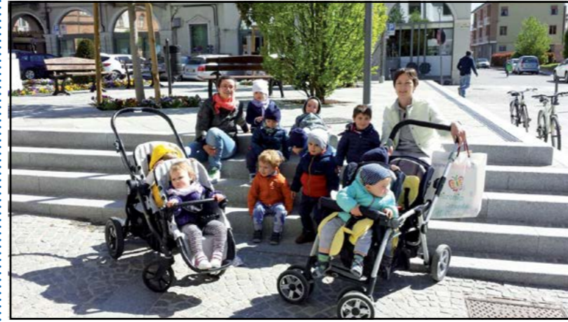
"A passeggio per Canale..."

Ogni anno le educatrici elaborano un progetto diverso per ciascun gruppo: i più piccoli maturano le autonomie e sperimentano le prime regole della convivenza; i più grandi, invece, seguono un argomento che fa da filo conduttore alle attività quotidiane. In questo anno che volge ormai al termine, i bambini sono andati alla scoperta delle 4 stagioni, giocando coi loro colori, frutti e profumi. E in questi giorni si sta anche ultimando il "progetto continuità" per facilitare il passaggio alla scuola dell'infanzia, sita al pian terreno della stessa struttura.