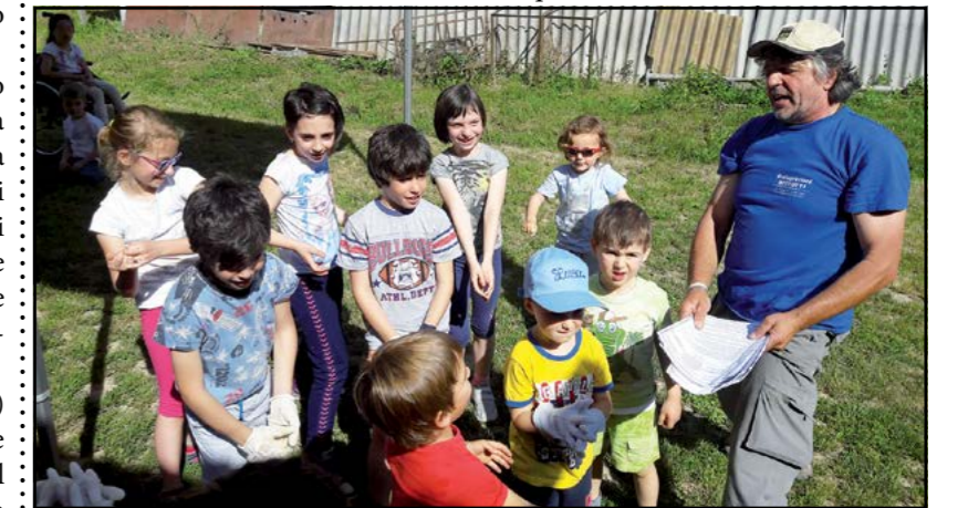
Smile: Tempo dedicato alla natura

In più, un progetto nuovo come "Smile": grande intuizione della nostra bibliotecaria Silvia Gilestro, in una lunga serie di appuntamenti pomeridiani tesi a mettere in contatto la lettura con arti quali la danza, la musica, la cucina,