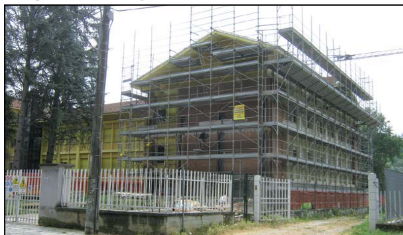
Istituto Comprensivo: Lavori in corso

Il progetto in questione è finanziato dall'Istituto per il Credito Sportivo di Roma nell'ambito dell'Accordo di collaborazione Presidenza Consiglio Ministri - Istituto Credito Sportivo - ANCI - UPI denominato "500 Spazi Sportivi Scolastici". Oltre ai lavori eseguiti la scorsa stagione per riqualificare l'area sportiva di via Mombirone (sistemazione dell'area pedonale prospiciente il campo di calcio, la recinzione, le torri fari e l'area circostante, anche in ambito scolastico, con la sistemazione delle piste di atletica ecc...), resta da realizzare un ultimo intervento di parziale ristrutturazione degli spogliatoi della Palestra Scolastica. L'esecuzione di questi ultimi lavori è prevista nei mesi estivi.