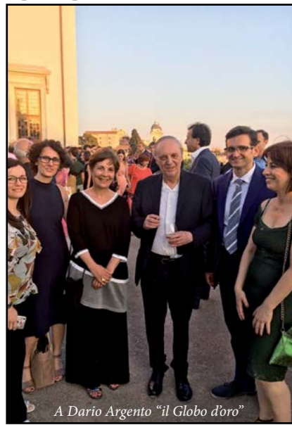
A Dario Argento "il Globo d'oro"