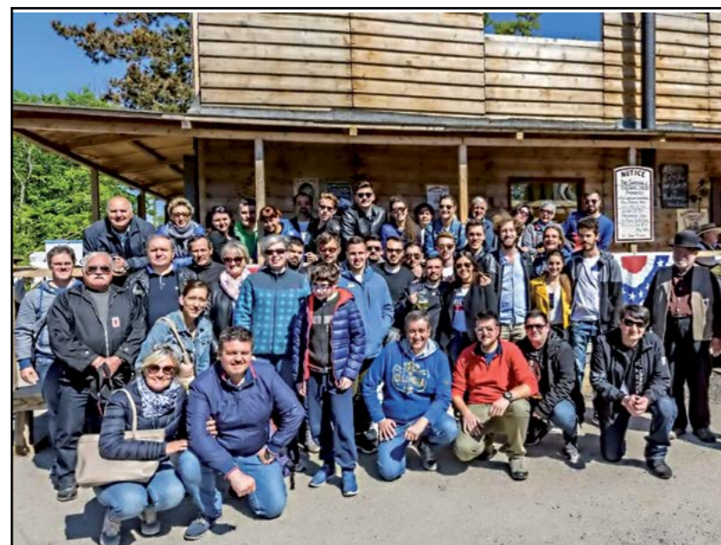
Alla "Festa degli Indiani" con i "Gemelli" di Sersheim

Anche quest'anno l'attività del Comitato Promozione e Gemellaggio è stata e sarà soggetta ad iniziative spinte alla collaborazione, nel nome dello spirito europeo che ci accomuna, con le cittadine di Sersheim e di Rodilhan. Abbiamo fatto visita, dal 29 Aprile al 1 Maggio, ai nostri gemellati tedeschi di Sersheim in occasione della "Festa degli Indiani", a cui partecipano persone da tutta la Germania con rievocazioni Far West. Una manifestazione che loro svolgono da 10 anni nella quale vengono allestite un centinaio di tende "Tipi" e un Saloon in stile americano.