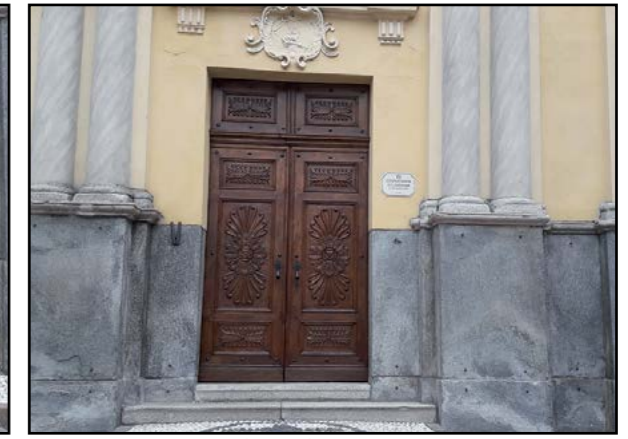
Il Portale restaurato