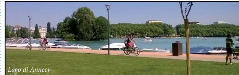
Lago di Annecy

Domenica 26 marzo un'uscita a Parma e dintorni; il 19 aprile si è effettuata una gita in Liguria, che ci ha fatto scoprire le sue perle: Portofino e Rapallo. Si è chiuso l'anno accademico con un fine settimana, il 17 e 18 giugno, in Savoia: Chambéry, Haute Combe e Annecy.