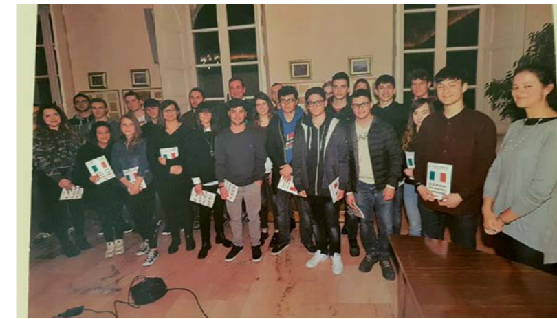
Incontro con il "Gruppo Leva"