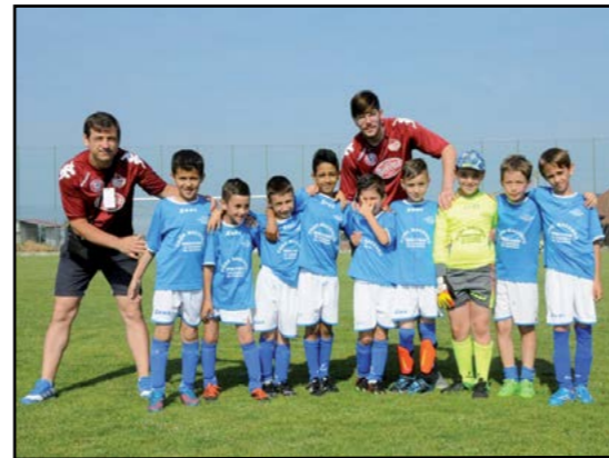
Piccoli amici 2009