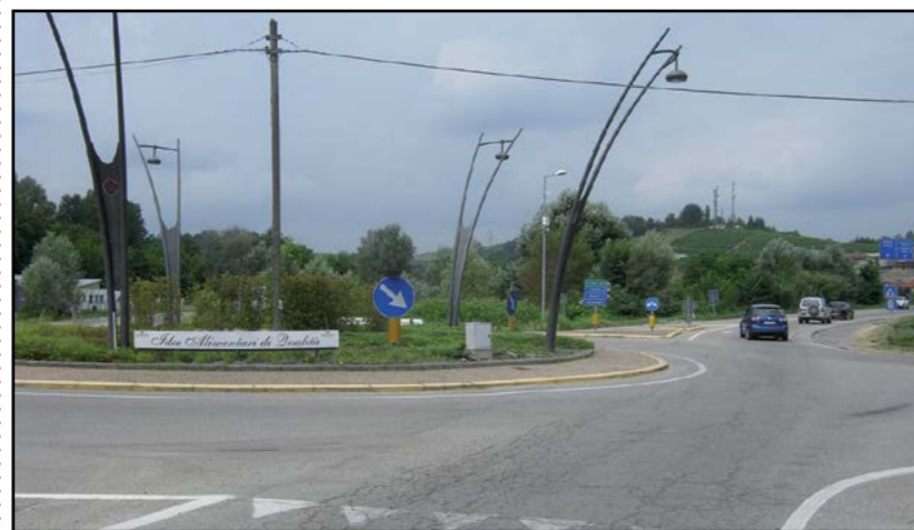
Rotatoria dell'incrocio Via Mombirone

La riqualificazione del lotto in questione è stata avviata con un costo stimato complessivo di circa 27.000,00 euro, Iva compresa.