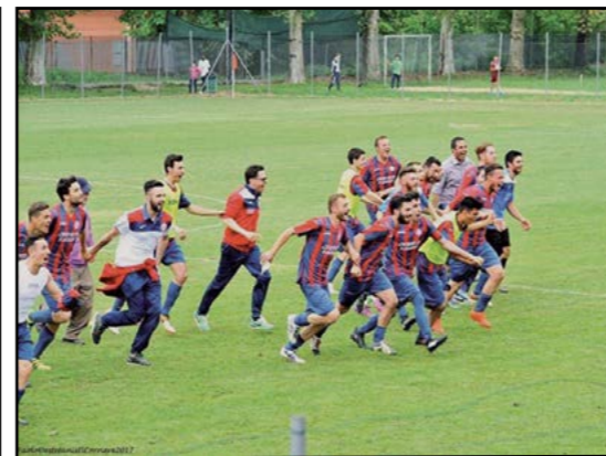
Canale Calcio festeggia