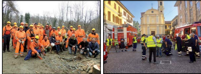
Gruppo Volontari A.I.B.