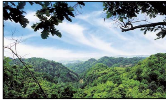
Vista Oasi S Nicolao da Roca taia

Nella presentazione ufficiale dell'iniziativa, avvenuta la sera del 10 Marzo scorso nel salone parrocchiale, hanno preso la parola i due copromotori dell'iniziativa, il Comune di Canale e "Natlurife International" e a seguire tutte le associazioni che