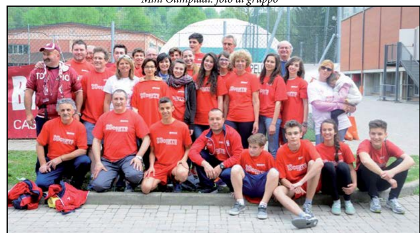
Direttivo Canale Sportiva

Anche quest'anno la scuola di Canale si è distinta per le sue innovazioni. Impossibile riassumerle tutte; ci limitiamo a sottolineare alcune novità.