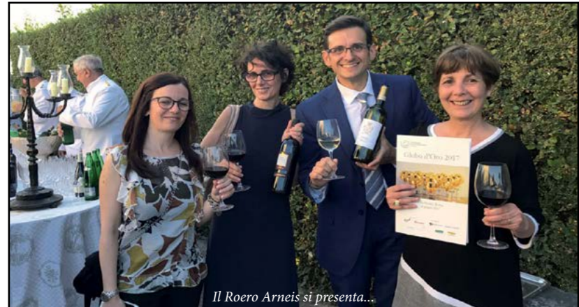
Il Roero Arneis si presenta...