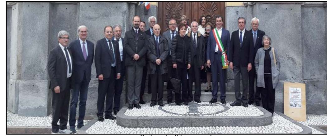
Cerimonia di inaugurazione