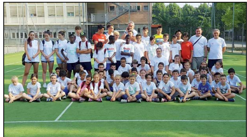
Mini Olimpiadi: foto di gruppo