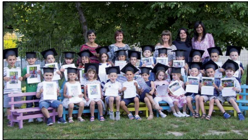
I "ventisette grandi" pronti per la 1ª Elementare

Ora siamo pronti a salutare i ventisette "grandi" che proseguiranno il loro viaggio nella cultura alla scuola primaria e ad aprirci, nuovamente, ad accogliere chi, a tre anni, scalpita per fare il proprio ingresso alla scuola dell'infanzia.