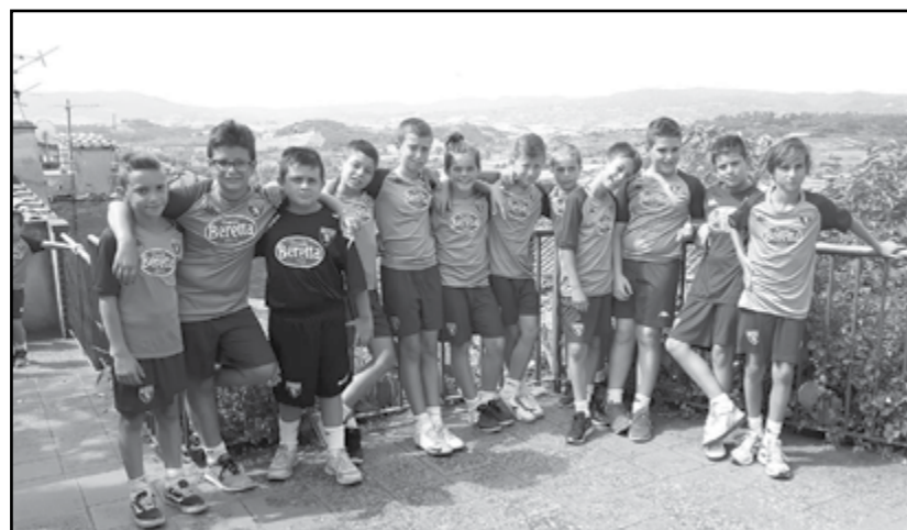
Summer Camp a Peccioli (Pisa)

Calcio: Prosegue la collaborazione tra Canale e Toro Academy. Oltre 150 canalesi sabato 5 novembre erano allo stadio "Grande Torino" con il settore giovanile del Canale Calcio.