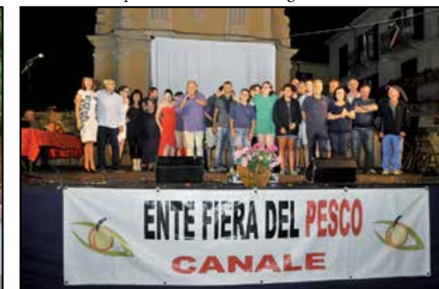
Il Gruppo dell'Ente Fiera sul palco del Cantaborgo