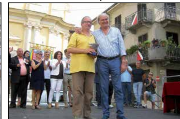
Un premio in amicizia a Borgo Fiorito...