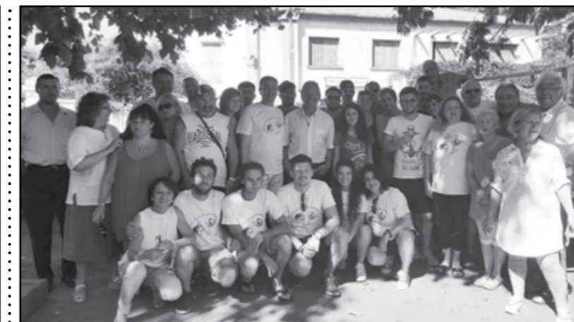
Foto di gruppo a Rodilhan 2016

Le nostre giornate assieme sono proseguite con la "Cena dell'Amicizia" all'Orto di Masche del venerdì sera, ed a seguire con il concerto degli "Eiffel 65" organizzato dall'Ente Fiera del Pesco. Al sabato, dopo l'escursione nelle Langhe per i motociclisti tedeschi accompagnati dalle nostre "Ruote Gemellate", abbiamo avuto modo di incontrarci nuovamente per un piacevole buffet preparato dall'Associazione Sportiva "Molino Galletto" che gentilmente ci ha ospitati. Il pomeriggio è poi proseguito alle cantine Maccagno dove la