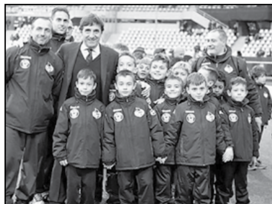
Allo stadio "Grande Torino"