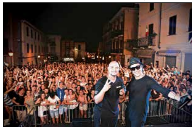
Successo con gli “Eiffel '65”