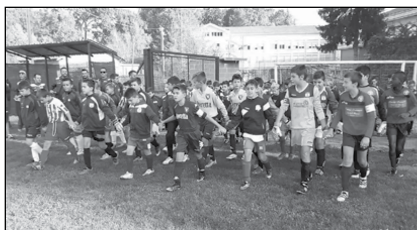
Ingresso in campo delle squadre impegnate nel Torneo di Settembre