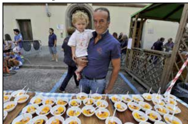
Prego signori, servitevi...