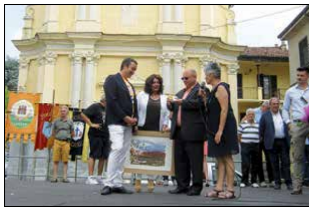
Lo scambio dei doni con Sersheim...