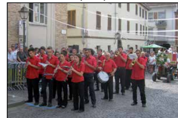
Momenti solenni con la Filarmonica di Santa Cecilia