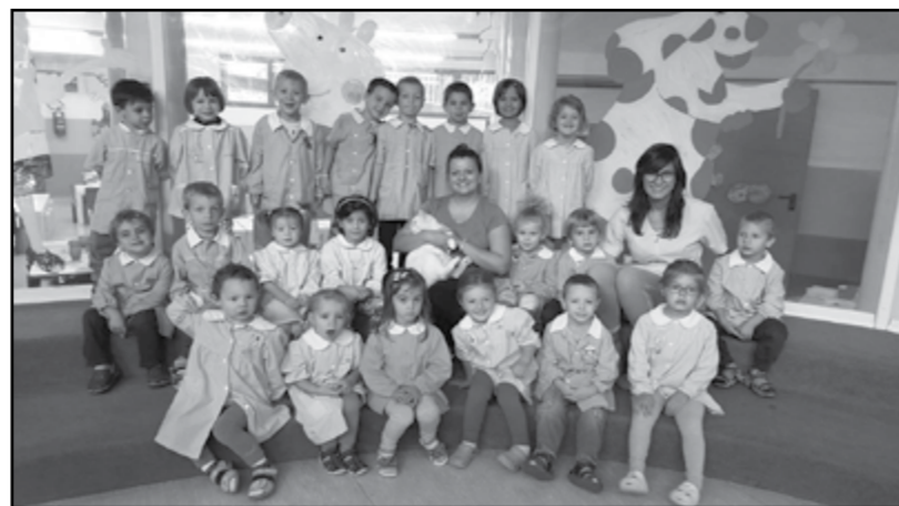
Sezione Tartarughe Asilo

Al Micronido si impara a conoscere il mondo giocando soprattutto con i materiali che ci offre la nostra amica natura; il nostro gioco consiste nel manipolare, assaporare, odorare, osservare, ascoltare quanto ci offre la stagione, a cominciare dall'autunno.