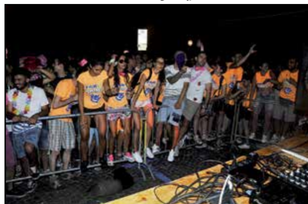
Gioventù in Notte Rosa...