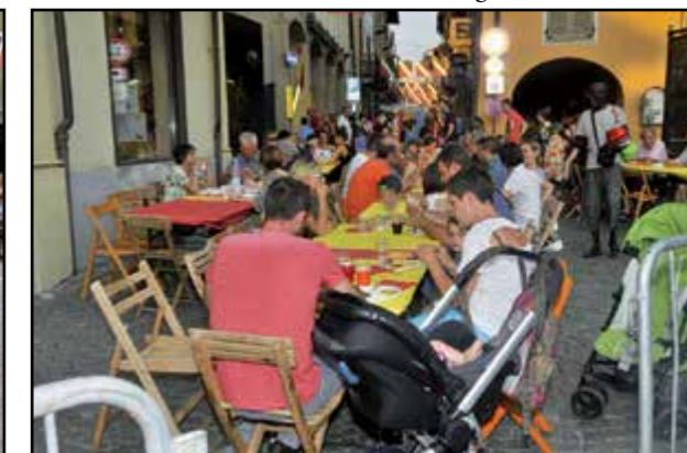
Grande partecipazione al Bon Apatit...