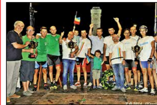
Premiazioni G.P. del Pesco 2016