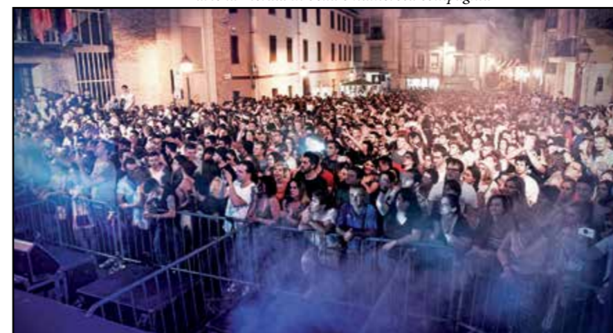
Serate con grande successo di pubblico...