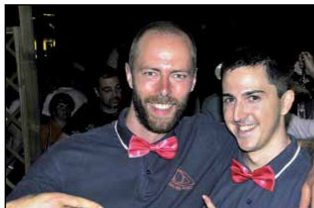
Espressioni da Notte Rosa...