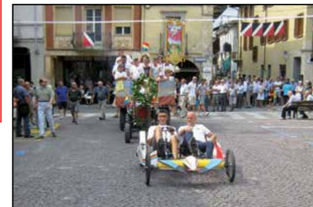
Ingresso del Borgo vincitore...