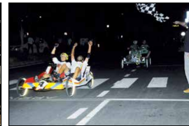
I vincitori esultano al traguardo...