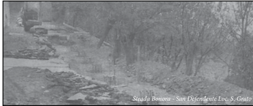
Strada Bonora - San Defendente Loc. S. Grato

Nell'intento di dar corso ai lavori con urgenza, gli stessi sono stati assegnati ad una serie di imprese locali, tra cui la Edilmurru Elli S.n.c., con un costo stimato complessivo di circa 43.000,00 euro, Iva compresa.