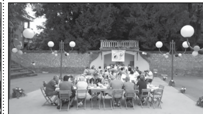
Una serata conviviale

La domenica mattina, dopo una generosa colazione preparata dagli amici di Rodilhan, siamo ripartiti per Canale. Come sempre sono stati tre giorni molto piacevoli, nei quali ci è stato possibile incontrare nuovamente i nostri amici consolidando i rapporti di amicizia ormai instaurati da parecchi anni.