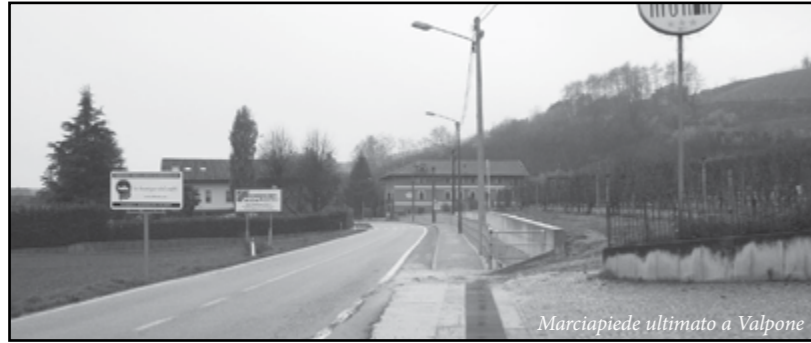
Marcia piede ultimato a Valpone

Lavori di consolidamento lungo la strada comunale Bonora-S. Defendente in località S. Grato