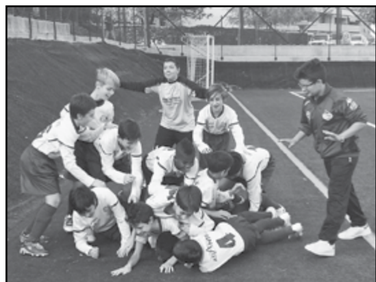
Esordienti 2° anno dopo una grande vittoria