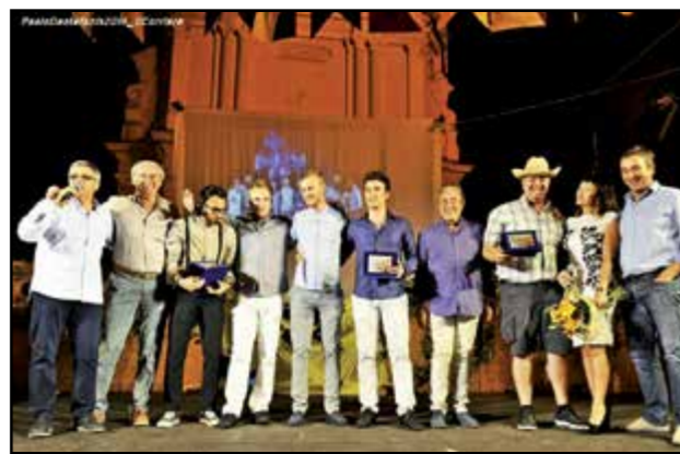
Premiati i vincitori del Cantaborgo...

Alla vigilia della Fiera un giovane di Canale su facebook ha scritto questo breve ma significativo commento: “domani iniziano Le Feste di Canale... la settimana più bella dell'anno”. Dalle belle immagini pubblicate su queste pagine, credo proprio che il giovane ed entusiasta amico canalese abbia avuto ragione. Le foto sono un concentrato di visi sorridenti e situazioni di festa e di allegria collettiva perché la Fiera del Pesco non è soltanto un grande contenitore di eventi diversi, ma il modo di vivere quei giorni, di una comunità che ha voglia di partecipare, di stare insieme e di condividere in amicizia momenti di gioia e di festa.