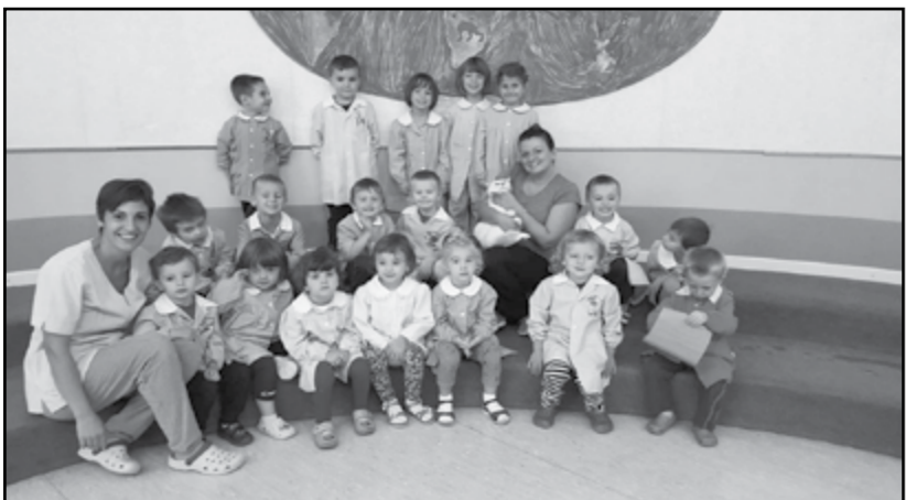
Sezione Orsetti Asilo