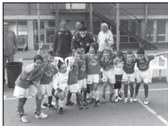
Calcio piccoli amici