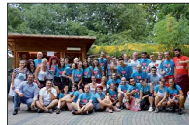
La meglio gioventù del Punto Enogastronomico