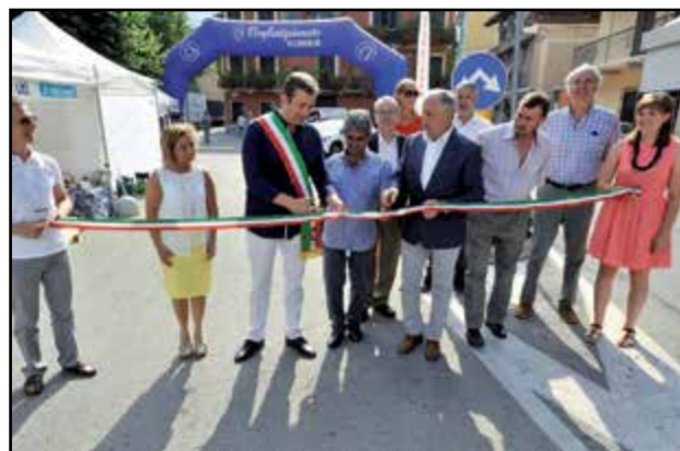
Inaugurazione Mostra Artigianale

(Collaborazione fotografica: Paolo Destefanis, Francesco Costanzo, Emanuele Costantino, Enrico Rustichelli)