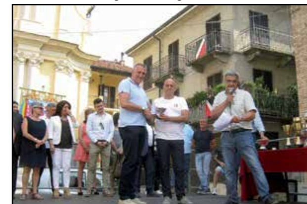
“Canale Sportiva” premia...