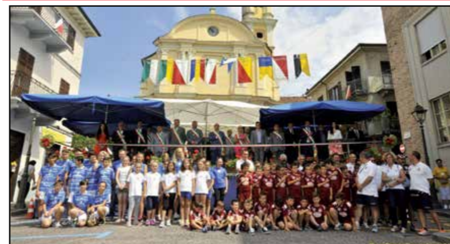
Parte la Fiera... in bella e numerosa compagnia