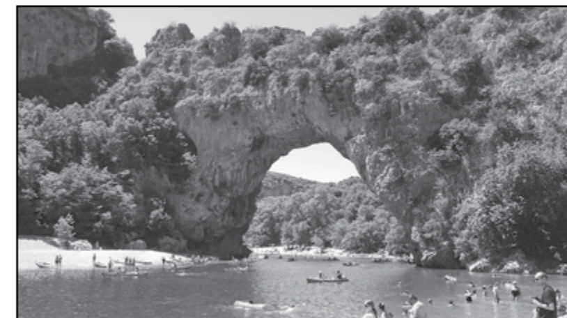
Rodilhan 2016: "les Gorges de l'Ardèche"