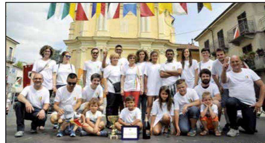
Il Palio a Borgo San Michele