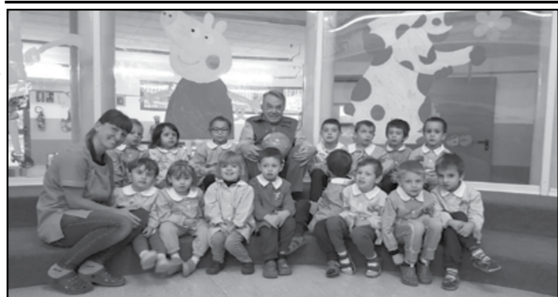
Sezione Farfalle Asilo