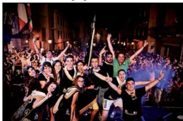
I coscritti del '98 in festa...