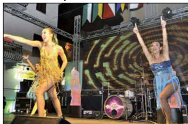
Serata frizzante con le “Explosion”...