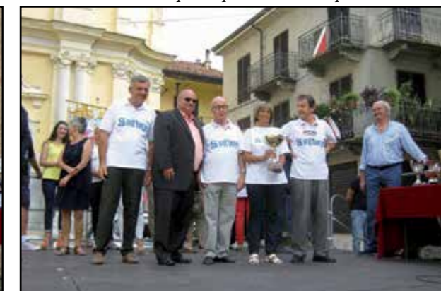
Premiati i boccioli di San Vittore