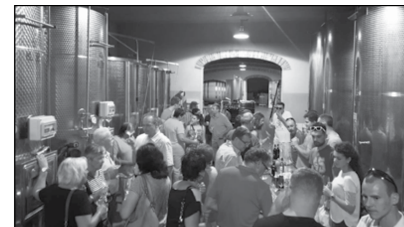
Una visita enologica con gli amici di Sersheim

Come di consueto anche quest'anno nel mese di Luglio siamo partiti alla volta di uno dei 2 paesi gemellati. Quest'anno abbiamo raggiunto i nostri amici di Rodilhan per un piacevole fine settimana accompagnati dalle nostre "Ruote gemellate": i rapporti si sono intensificati a tal punto che viene organizzata anche per i centauri, dagli amici che ci ospitano, una gita nei loro luoghi più suggestivi. Dunque, siamo partiti venerdì 8 luglio e al nostro arrivo siamo stati accolti ed accompagnati al liceo ed in albergo. La serata si è conclusa con la cena offerta dal Comitato Gemellaggi di Rodilhan. Al sabato, dopo essere stati ospitati alla "colazione nel prato" offerta dal Comune (praticamente un pranzo) siamo