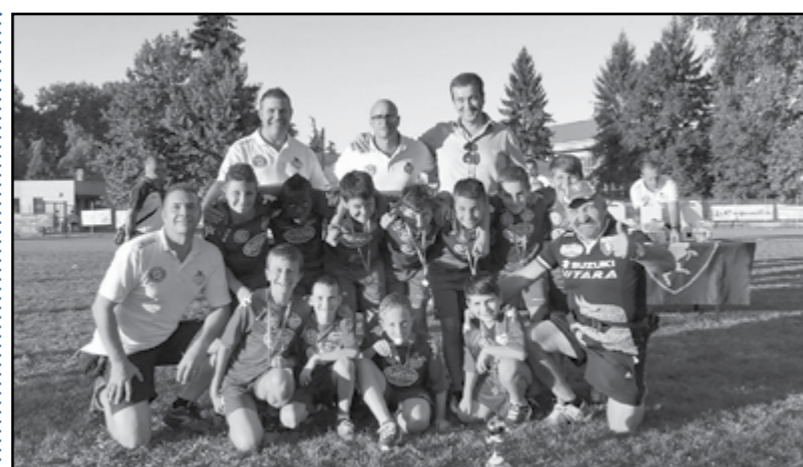
Pulcini 3° anno