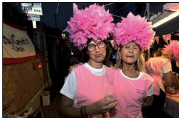
Borgo Centro-S. Bernardino in rosa...