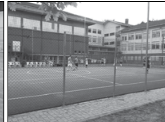
Anno 2016: Calcetto