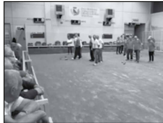
Anno 2016: Gara a Bocce