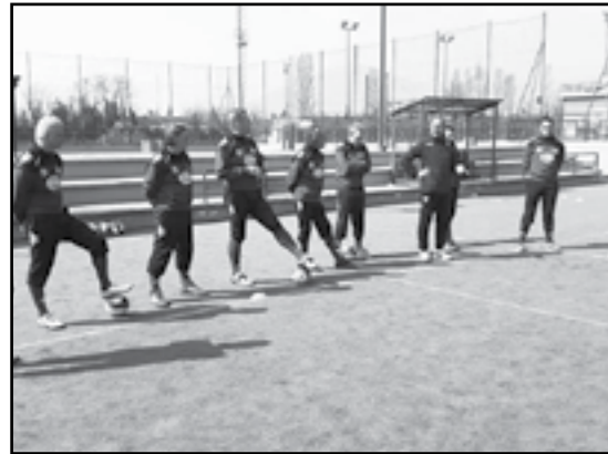
Allenatori in campo