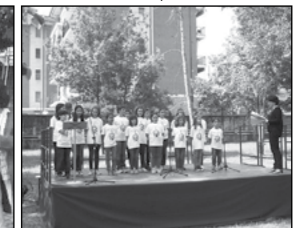
Esibizione al Nuovo Parco