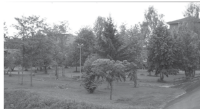
Giardino Pubblico con percorso Fitness-Natura

I lavori sono stati realizzati ed ultimati nei primi mesi del 2016.