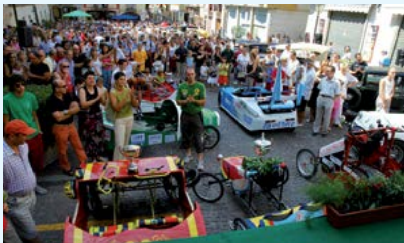
Anno 2005: Apoteosi finale della Fiera

La tradizionale Fiera del Pesco continua a presentare lo splendore di un territorio dalle peculiarità incomparabili. Una settimana di festa, dedicata agli ospiti italiani e stranieri che l'Ente Fiera, l'Amministrazione comunale e i Borghi con mirati programmi sapranno ancora una volta allietare tutti coloro che vi parteciperanno.