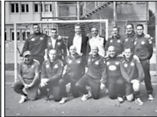
Dirigenza Torino Academy