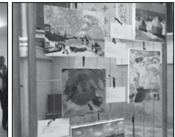
Mostra: "Bonjour Monet"