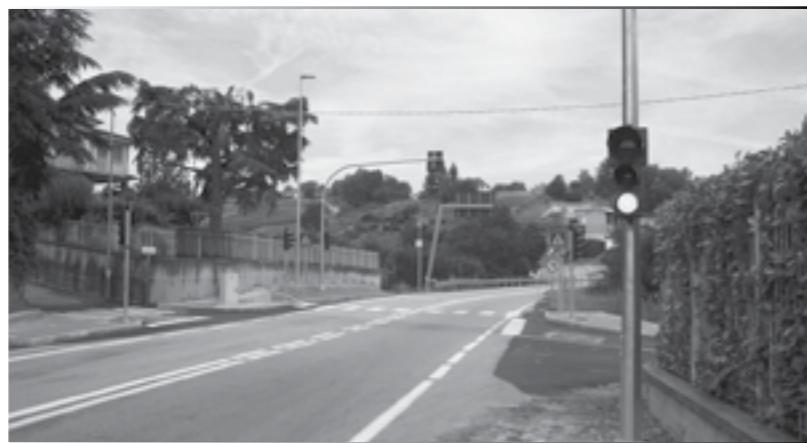
Lavori ultimati: Semaforo Via Cornarea

La spesa per l'intero allestimento, e la realizzazione delle opere propedeutiche allo stesso, è stata di euro 36.000,00 circa.