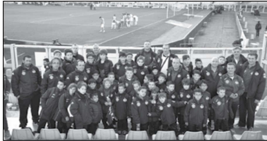
Allo stadio "Grande Torino"