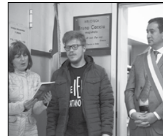
Biblioteca intitolata a Bruno Caccia

Nella mattinata sono stati consegnati gli attestati del KET (certificazione in-