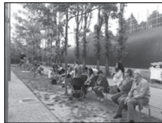
Anno 2016: Spettatori alla Polisportiva