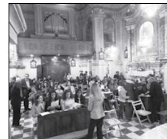
Presentazione Mostra "Bonjour Monet"