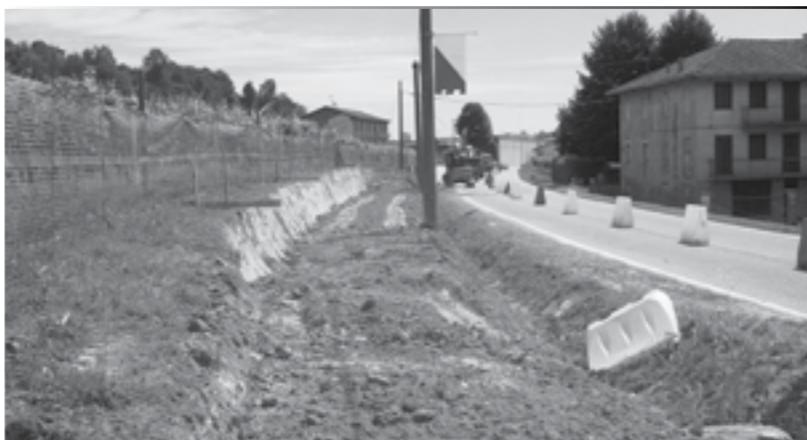
Lavori in corso: marciapiede in Frazione Valpone

Lavori di sistemazione di via Cecilia Buffetti