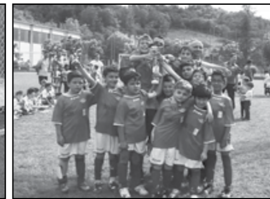
Vittoria dei Pulcini 2008