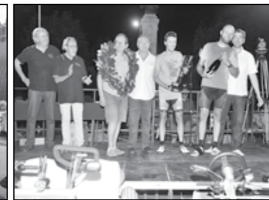
Anno 2015: G.P. a Borgo Fiorito