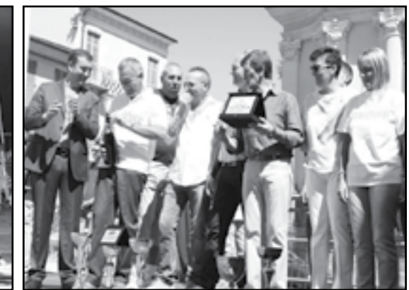
Anno 2015: il Palio a Borgo San Vittore