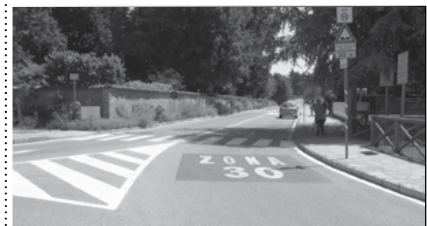
"Zona 30" in Viale del Pesco

La proposta progettuale presentata dall'Amministrazione Comunale è stata approvata ed ammessa a contributo. Secondo le disposizioni dettate dalla Regione Piemonte, il comune ha appaltato l'opera alla ditta Franco Barberis Spa. I lavori sono stati avviati in concomitanza con la chiusura dell'attività scolastica con la previsione di ultimarli entro fine anno.