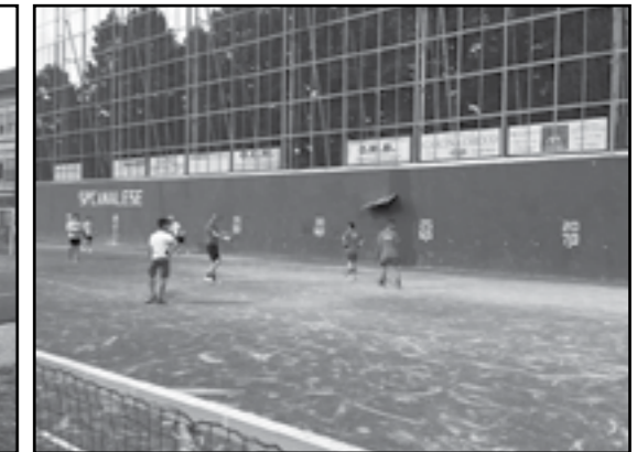
Anno 2016: Pantalera