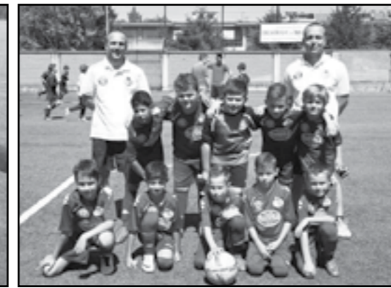
Piccoli amici 2007