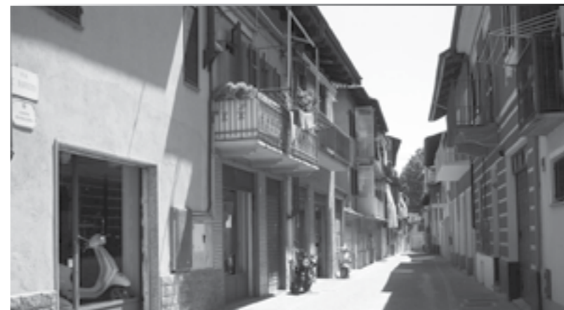
Lavori ultimati: pavimentazione Via Cecilia Buffetti

Lavori di riqualificazione dell'area sportiva scolastica di Canale.