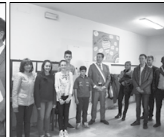
Momenti del progetto: "Il silenzio è dolo"