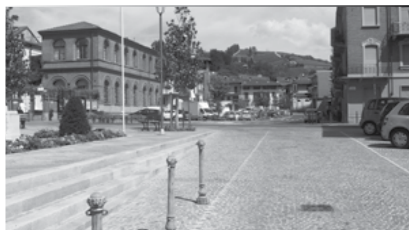
Lavori ultimati: Piazza Martiri della Libertà e Piazza della Vittoria

L'opera è stata appaltata alla ditta Tecnoedil Lavori S.c.a.r.l. di Alba. I lavori sono stati avviati nel mese di settembre 2015 ed ultimati, con le ultime asfaltature, lo scorso mese di aprile.