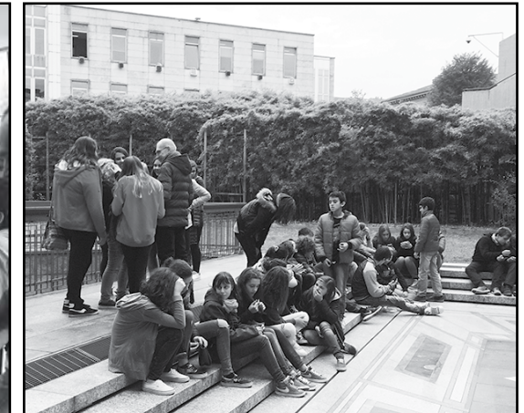
Alla Galleria GAM di Torino