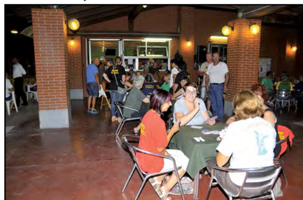
Che passione il gioco delle carte