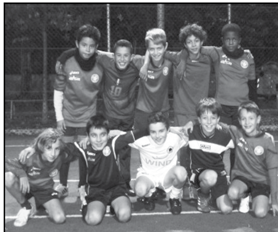
I Pulcini del 3° anno - Anno 2005