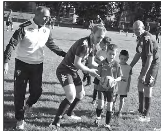
Open Day Toro

Calcio L'ASD Canale calcio, affiliata ufficialmente al TORINO FC, è nel pieno dell'attività sportiva. Domenica 6 settembre tanti giovanissimi calciatori, con le loro famiglie hanno partecipato al primo "Open day" organizzato dal Torino Calcio Academy. Tutti i partecipanti hanno avuto modo di conoscere da vicino la nuova realtà calcistica canalese, attorno alla quale si muovono tecnici e allenatori adeguatamente preparati, grazie anche alle indicazioni e alla preparazione offerte dalla gloriosa società torinese. Il 21 ottobre oltre 100 ragazzi del settore giovanile sono stati invitati allo Stadio Olimpico di Torino per assistere al primo incontro della Youth League. Si tratta della massima competizione per club giovanili a livello europeo, l'equivalente della Champions League. Bellissima esperienza di pomeriggio allo stadio!