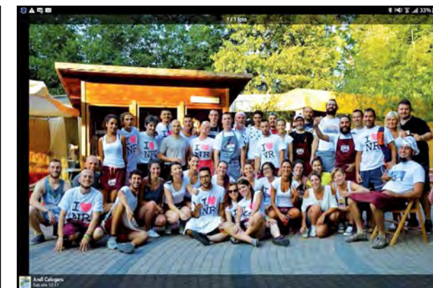
...tutti al Punto Enogastronomico