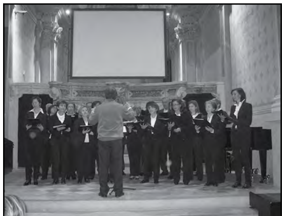
Corale Parrocchiale S. Vittore