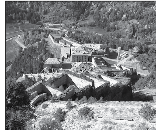
Gita al Forte di Fenestrelle

La scuola considera i viaggi di istruzione parte integrante e qualificante dell'offerta formativa e momento privilegiato di conoscenza, comunicazione e socializzazione. Anche in questo anno scolastico la scuola secondaria ha realizzato le uscite didattiche dell'accoglienza: le classi prime sono state al forte di Fenestrelle, le seconde alla Certosa di Pavia e le classi terze al planetario di Pino Torinese e alla galleria GAM di Torino per la mostra di Monet. Ma non è finita qui... Monet arriverà a Canale con una mostra dedicata alla comunità. Per ora, sul resto, niente anticipazioni!