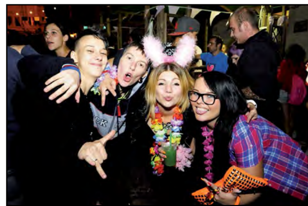
Notte Rosa: "facce birichine"