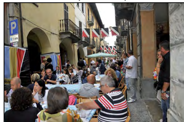
La serata del "Bon Aptit"