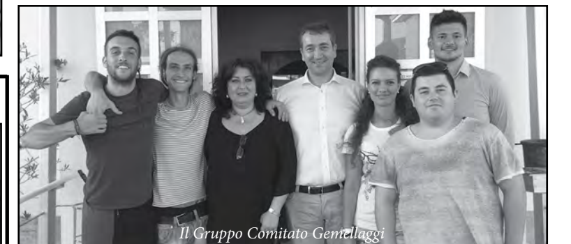
Il Gruppo Comitato Gemellaggio