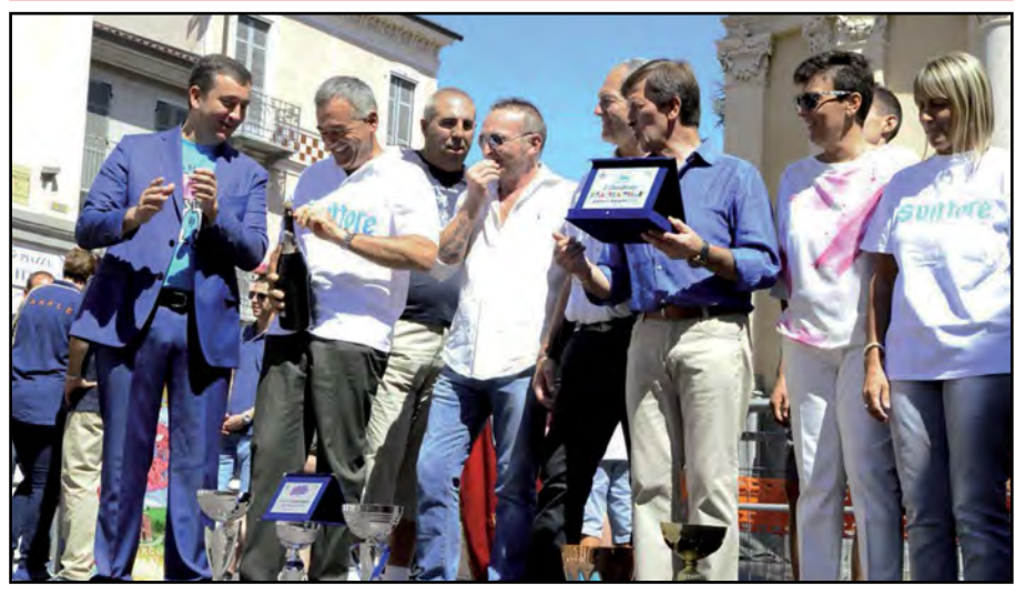
Il Palio 2015 a S. Vittore