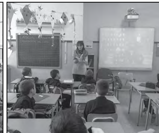
Momenti dedicati alla lettura