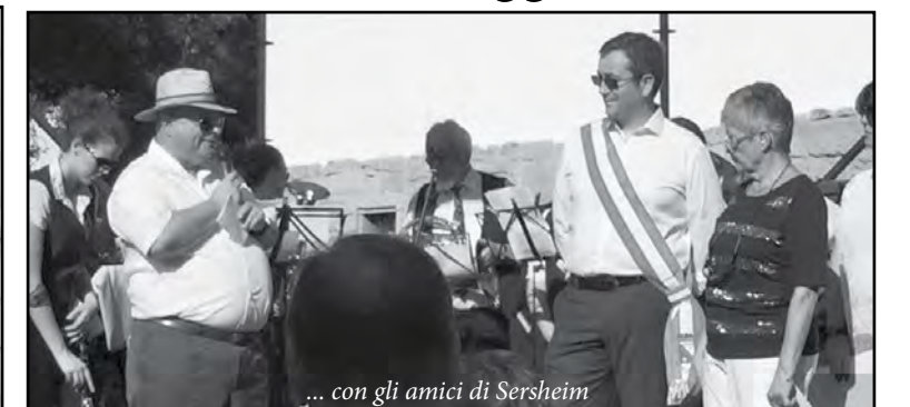
... con gli amici di Sersheim