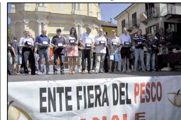
I costruttori del G. P. premiati