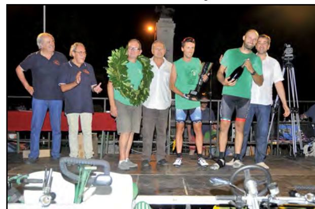
Gli eterni campioni del Borgo Fiorito