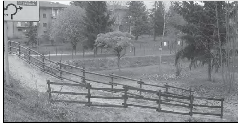
Giardino Pubblico: "Percorso Fitness Natura"

La spesa stimata per l'intero allestimento, e la realizzazione delle opere propeedeutiche allo stesso, è stata di euro 36.000,00 circa.