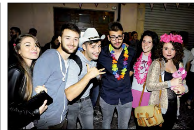
Notte Rosa: ...la gioventù si diverte