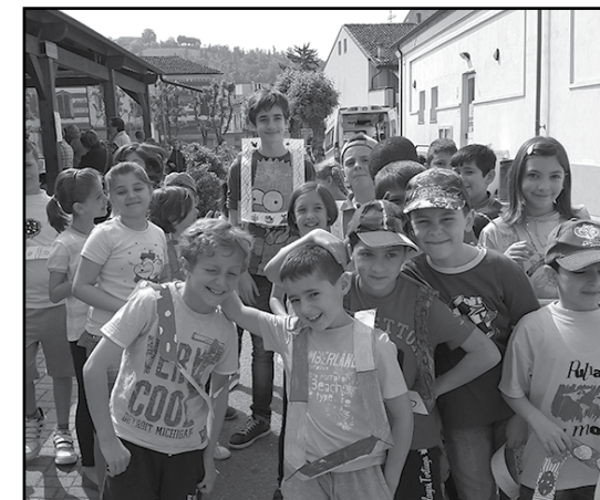
Rassegna "Buoni Frutti per tutti"