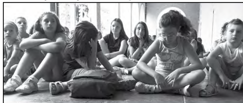
Estate Adolescenti: un po' di relax...

L'estate adolescenti si è sviluppata in itinere, a conclusione del percorso di Estate Ragazzi, coinvolgendo ragazzi dalla prima media alla seconda superiore. E' stata una settimana intensa, anche per merito della concomitanza con la Fiera del Pesco, che ha visto i partecipanti cimentarsi in giochi sportivi, compiti, escursioni e, soprattutto, rendersi protagonisti attivi nel paese, ripulendo tutta la pista ciclabile che collega Canale a Valpone. Una splendida esperienza, che vedrà, per il futuro, numerose novità, affinché l'estate sia vissuta al meglio dai ragazzi del nostro paese.