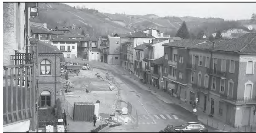
Lavori in corso: Piazza Martiri della Libertà

L'opera è stata appaltata alla ditta Tecnoedil Lavori S.c.a.r.l. di Alba. I lavori sono stati avviati nel mese di settembre e sono attualmente in corso. Saranno ultimati entro l'anno.