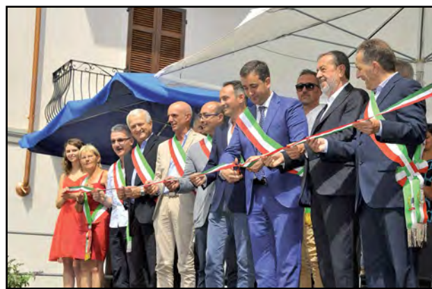
Il taglio del nastro...