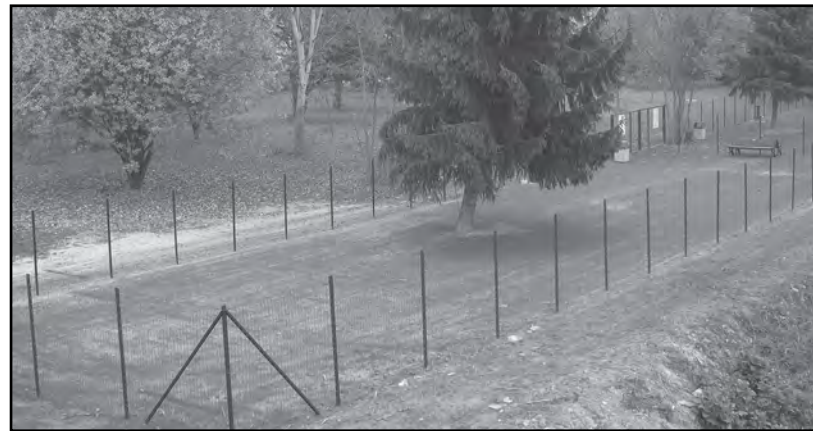
Giardino Pubblico: spazio attività motoria cani