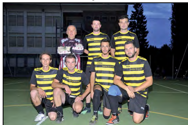
Calcetto Borgo Madonna dei Cavalli