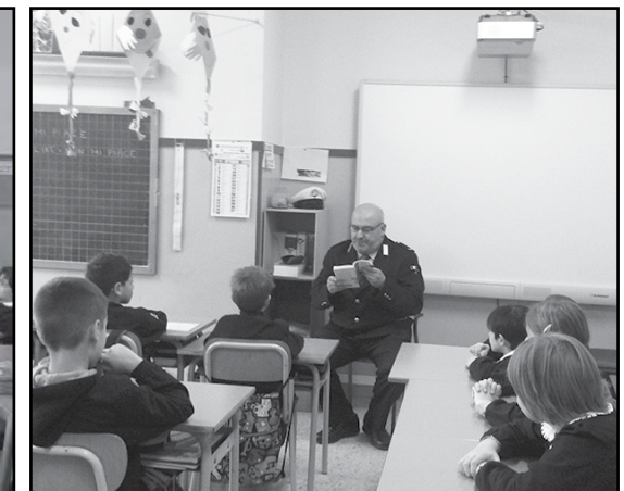
... altre lezioni di lettura