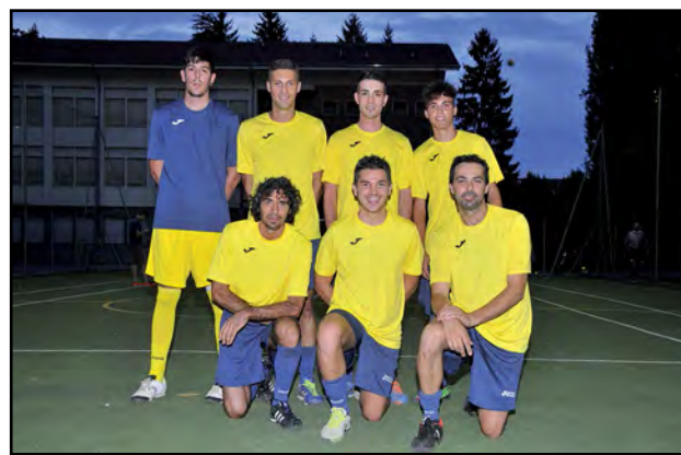
Calcetto Borgo S. Croce