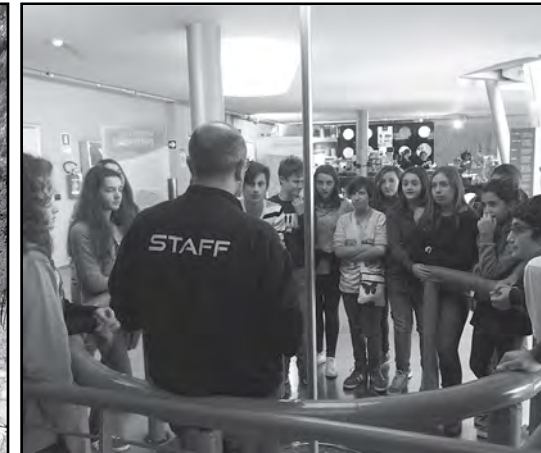
Al Planetario di Pino Torinese