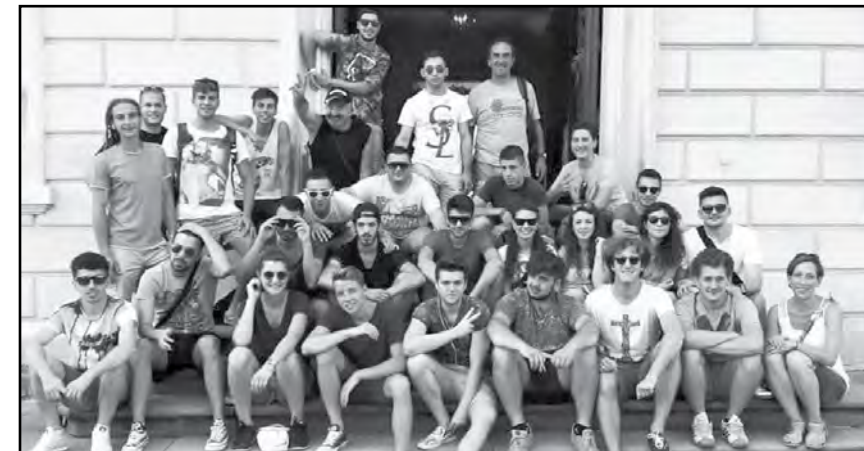
Gita a Sersheim 2015