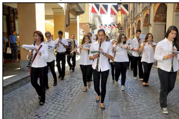
La Filarmonica Santa Cecilia