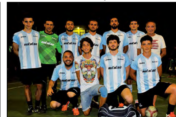
Calcio Borgo S. Vittore