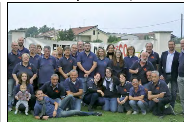
L'Ente Fiera del Pesco 2015