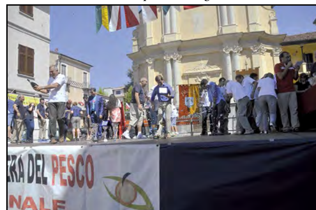
Borgo S. Vittore festeggia...