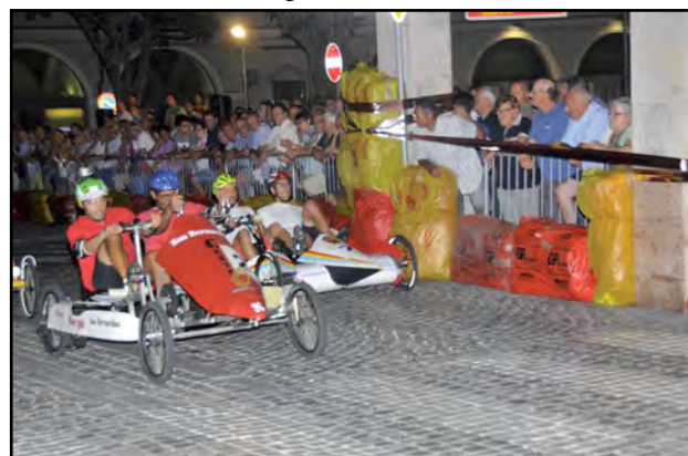
Sfrecciano i bolidi del G.P. ....