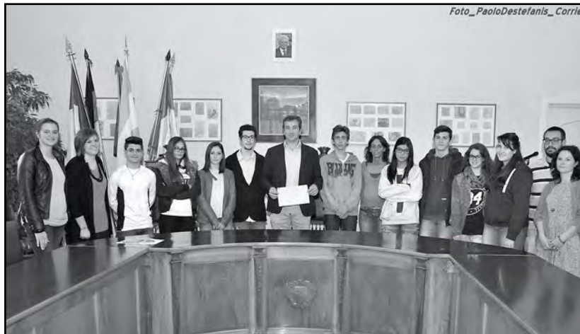
Estate Lavoro 2015: consegna degli attestati