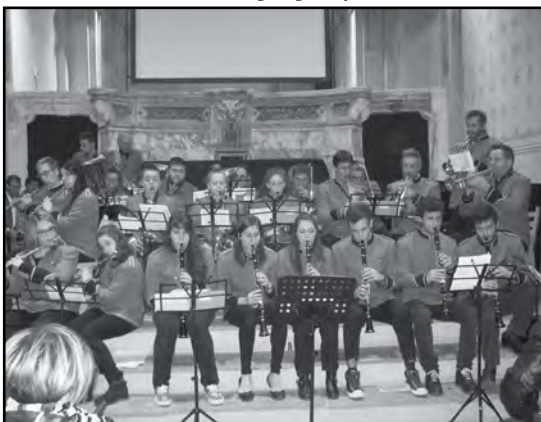
Filarmonica Santa Cecilia