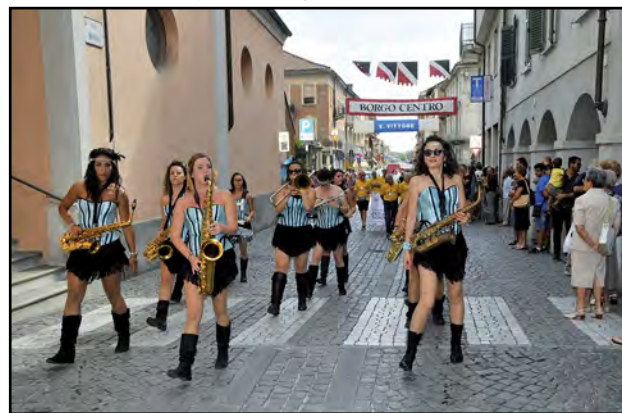
Le intriganti "Girlesque Street Band"

Iniziata in giugno con le gare del Palio dei Borghi, ritornato finalmente in tutto il suo splendore, la lunga e calda estate canalese ha avuto il suo apice nella nove giorni dedicata alla 73 a Fiera del Pesco. Il ricco e variegato programma, proposto con la consueta maestria dall'Ente Fiera, ha incontrato il favore dei canalesi e dei tanti visitatori che hanno scelto la nostra Città per trascorrere dei momenti di svago e di allegria.