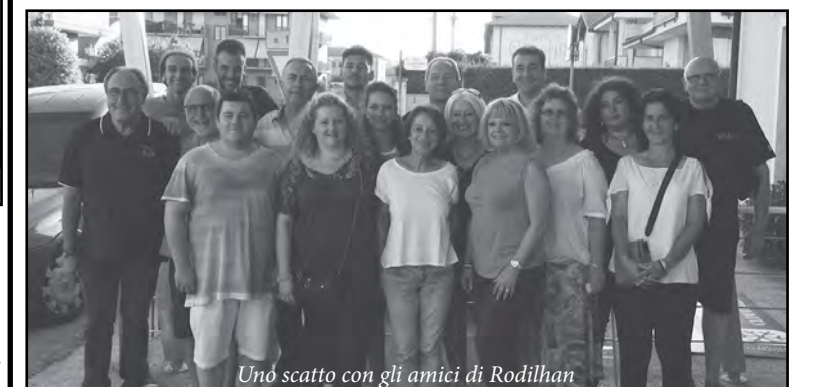
Uno scatto con gli amici di Rodilhan

Anche il 2015 è trascorso all'insegna dell'amicizia, dei numerosi impegni e del divertimento.