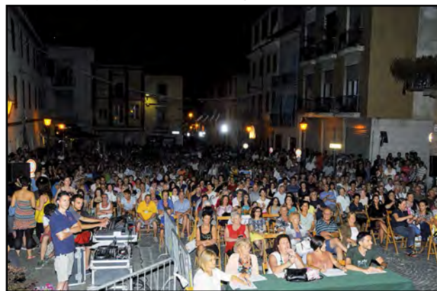
Pienone al Cantaborgo