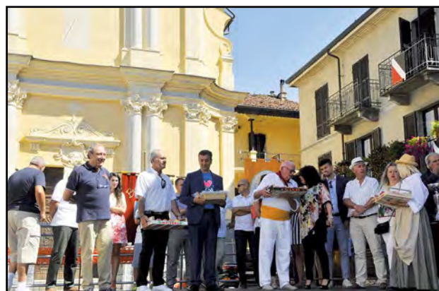
Le pesche di Canale ai cugini di Rodilhan