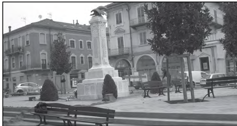
Lavori in corso: Piazza della Vittoria