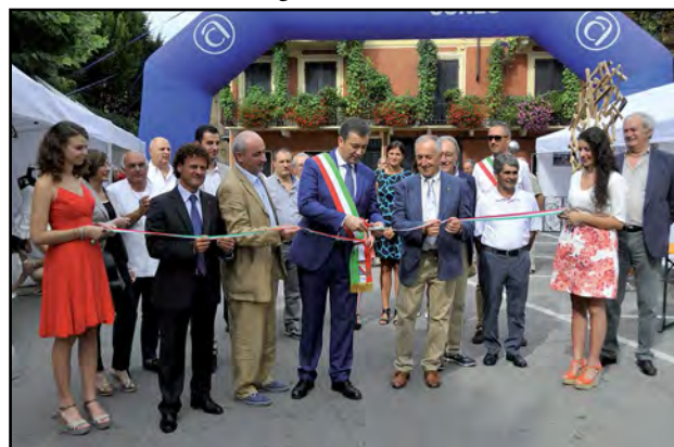
Inaugurazione Mostra Artigianale