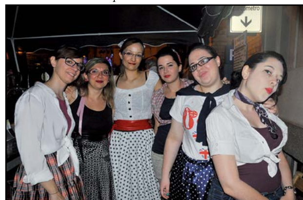
Le Girls Anni '50