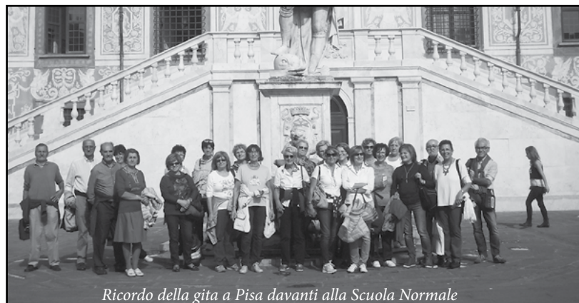
Ricordo della gita a Pisa davanti alla Scuola Normale

Nel mese di ottobre, è iniziata l'attività dell'Unitre per l'anno accademico 2014/2015, con un consistente e variegato programma. Il direttivo si è espresso così: «Dal 1° ottobre, abbiamo iniziato un altro anno augurandoci che le nostre attività e proposte incontrino un favore sempre maggiore. Confermiamo l'orario abituale, mercoledì pomeriggio alle ore 15 in Biblioteca, con cadenza quindicinale, salvo variazioni comunicate con le solite locandine o volantini. Sono ancora aperte le iscrizioni al nostro gruppo, al momento siamo una cinquantina tra rinnovi e nuove iscrizioni. Invariata la quota annuale di 15 euro (25 euro per la coppia). Grazie a tutti quelli che così aiutano le nostre attività».