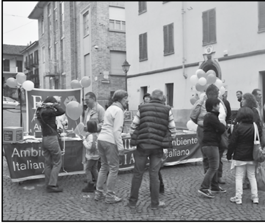
Il Banco FAI per la registrazione