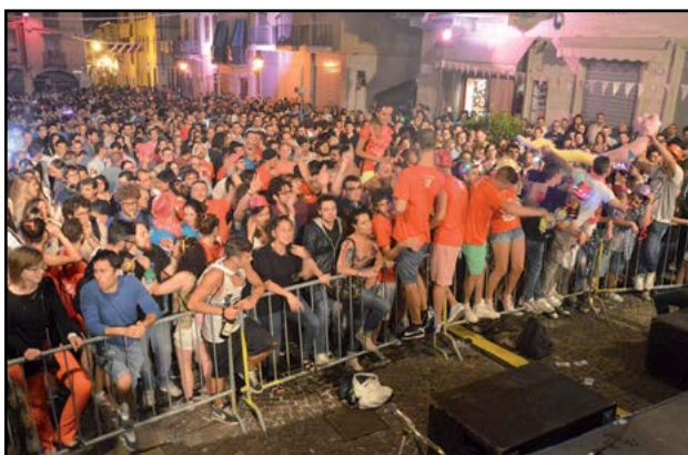
Tanta gente alla Notte Rosa