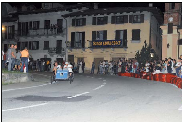
Il bolide in corsa...