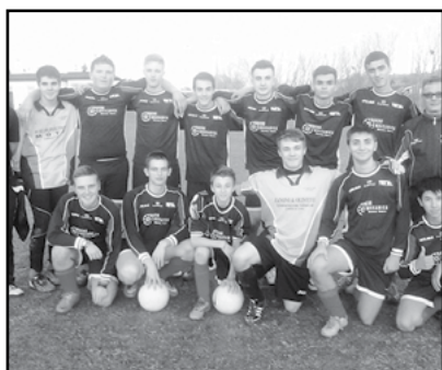
Allievi Canale Calcio