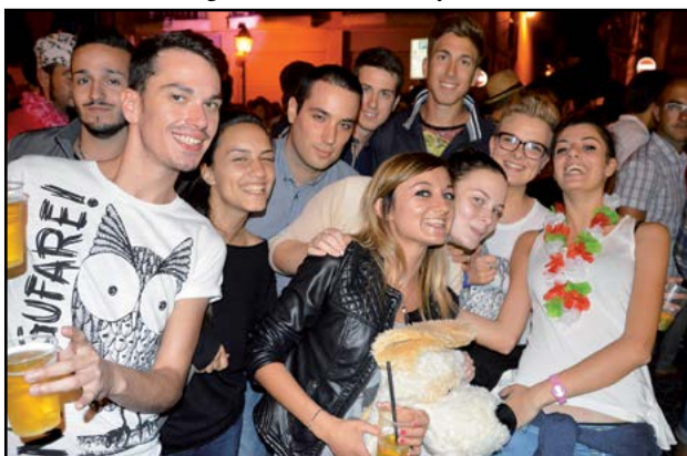
Facce da Notte Rosa