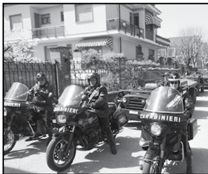
Uno scatto in occasione del raduno a Cherasco Aprile 2014