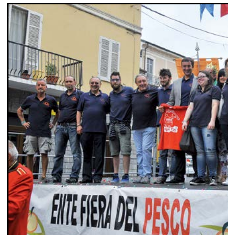
L'Ente Fiera del...