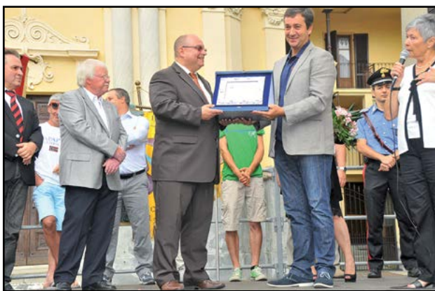
Giornata di Gemellaggio

(foto per la collaborazione fotografica)