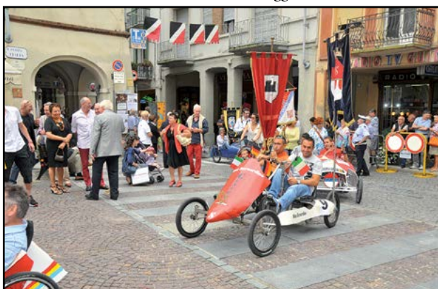
Sfilata di bolidi...