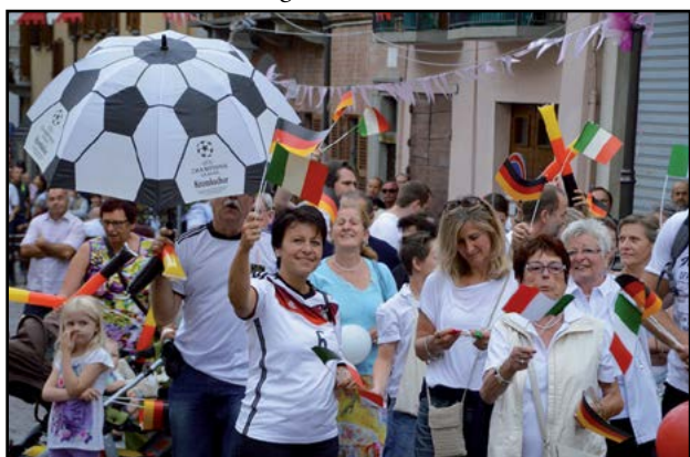
Gli amici di Sersheim