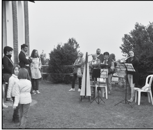
Musica e Arte a Madonna di Loreto