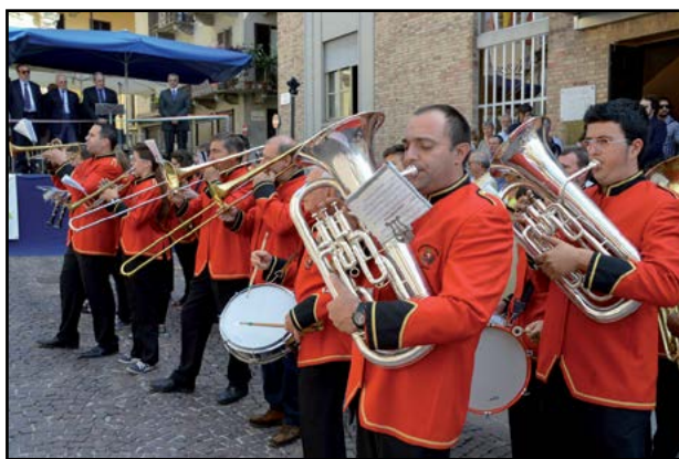
La filarmonica Santa Cecilia