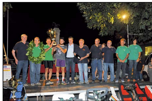
Borgo Fiorito sul podio