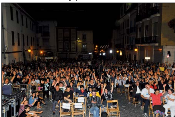
Gran pubblico per il Cantaborgo