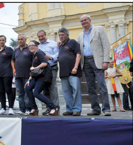
Il Pesco 2014