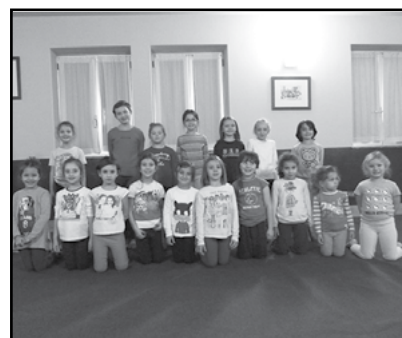
Il gruppo Ginnastica ritmica