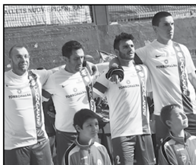
Pallapugno: campioni d'Italia 2014