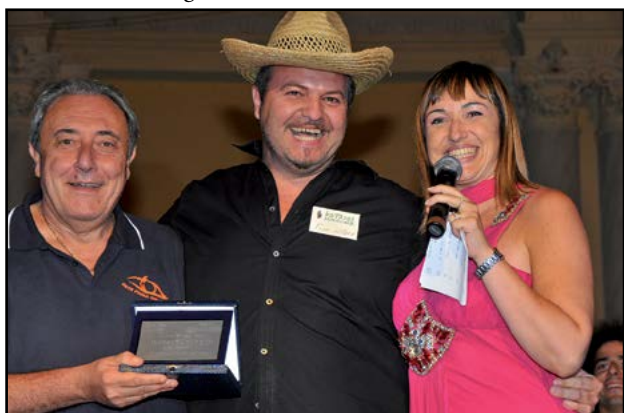
La voce del Centro