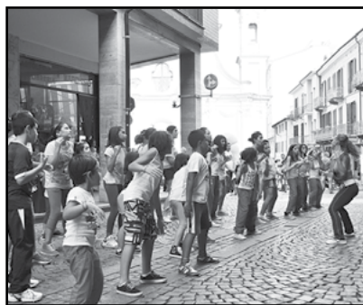
Sport in Piazza