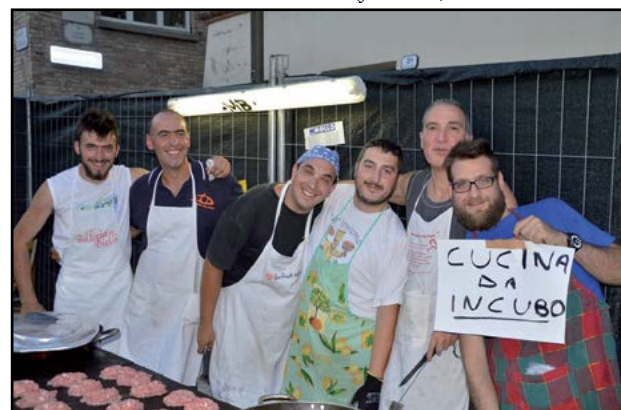
I fantastici cuochi all'opera...