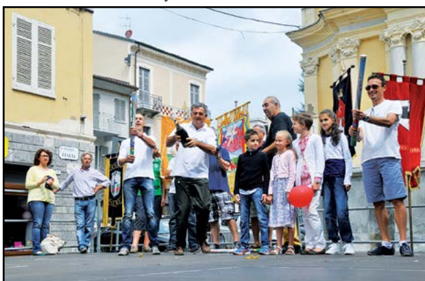
San Vittore vincitore del Palio