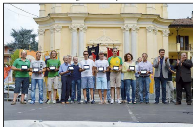
Il premio ai costruttori