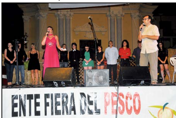
I magnifici conduttori...