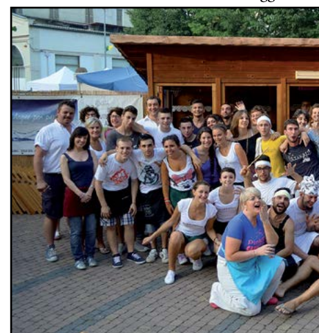
Il gruppo del Punto

Una nove giorni ricca di tante sorprese e di tante belle immagini pubblicate, ben evidenziate che hanno caratterizzato la 72 a Fiera del Pesco un ricco e variegato programma predisposto dal Comune di Canale e dei tanti visitatori che hanno scelto momenti di svago e di allegria. Molto nutrita la presenza dei nostri "gemelli" Musicali al seguito hanno ulteriormente arricchito. Tanta musica e di tutti i generi, spettacoli di eccellenza proposta dai ragazzi del Punto, i giardini del Castello, il Palio dei Borghi che il Comune del Pesco e Cantaborgo, ha mantenuto inalterate tante emozioni. E poi ancora tanti avvenimenti fotografici, la festa di Leva dei neo diciottenni. Tutto questo è stato possibile grazie alla simpatia che hanno contribuito alla riuscita della manifestazione del Punto, al Comitato Gemellaggio, ai Capitoli Dipendenti comunali, alle Forze dell'Ordine, ai vigili, ai Carabinieri in congedo, agli insistenti amici che come sempre non ci hanno fatto mancare.