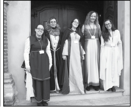
Le Madamigelle in San Bernardino

Lo scorso 12 ottobre, Canale, è stata sede della FAI MARATHON, la speciale manifestazione, di livello nazionale, del Fondo Ambiente Italia, organizzata con l'intento di far conoscere le tante bellezze, a volte nascoste e sconosciute, di luoghi e località di particolari interesse storico, culturale e paesaggistico di cui è ricca la nostra bella Italia. Nel mese di giugno siamo stati contattati dai referenti della sezione FAI di Cuneo e di Alba, per richiedere la nostra eventuale disponibilità ad ospitare questa manifestazione e di proporre un eventuale programma di visita. Un programma di massima era stato preparato tenendo conto delle tante eccellenze che sono presenti nella nostra Comunità e in particolare dei suoi aspetti legati all'arte, al paesaggio e alle tradizioni. La nostra proposta è stata accettata e siamo stati inseriti come una delle 120 città italiane ospitanti la manifestazione. Nonostante una giornata grigia e fredda sono stati oltre 200 i partecipanti alla maratona che prevedeva: in Piazza Italia presso il banco F.A.I per la registrazione e la composizione dei gruppi, la partenza con destinazione: Chiesa