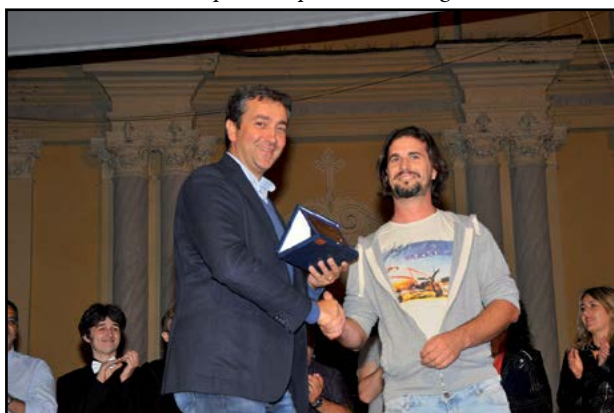
Il vincitore del Cantaborgo