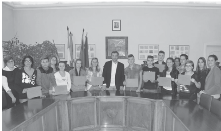
Consegna degli attestati