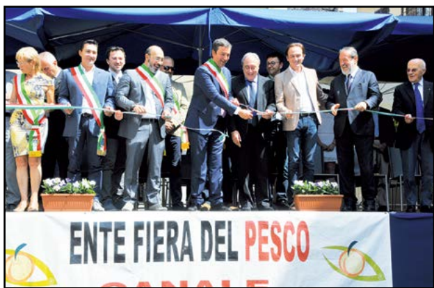
Il taglio del nastro...