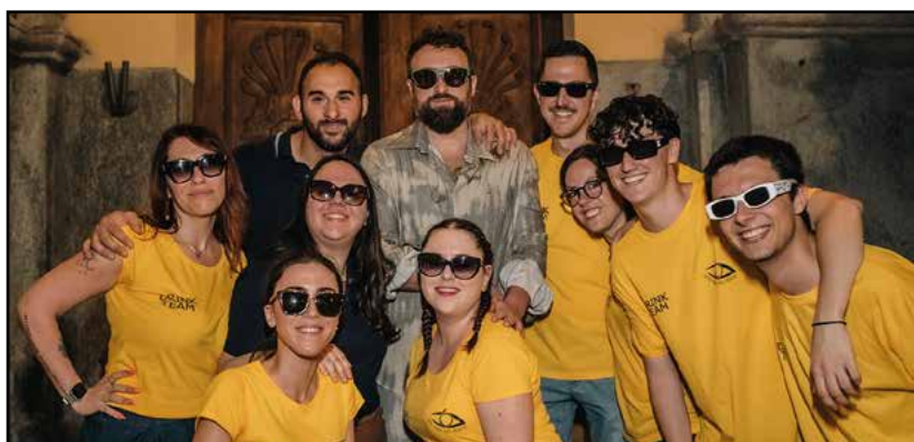
Il Mitico Dargen D'Amico...