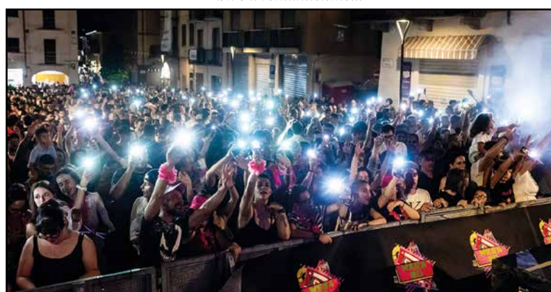
Notte Rosa: gioco di luci...