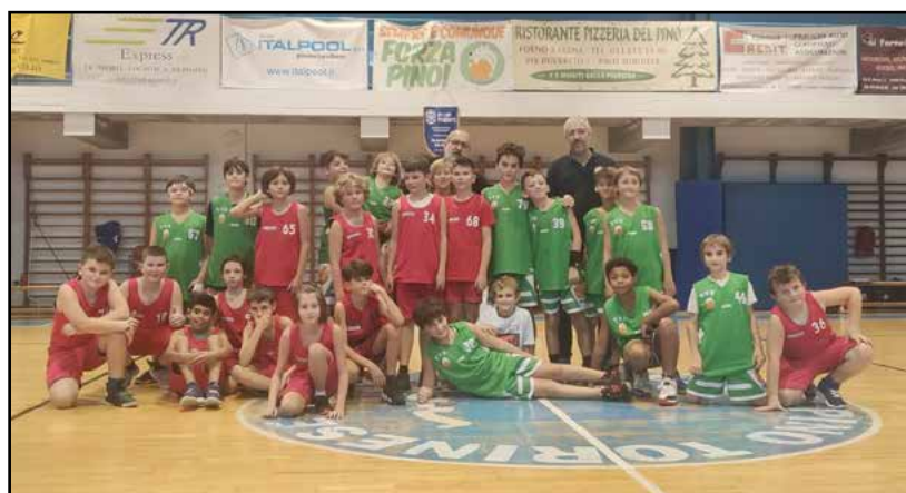
Prima gara della stagione 2023-2024 Pino Torinese vs Red Fox Canale categoria esordienti.