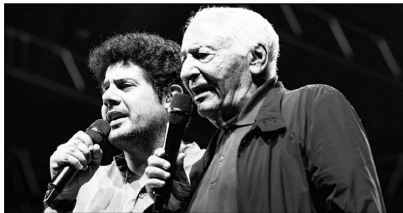
Mogol e le sue melodie...