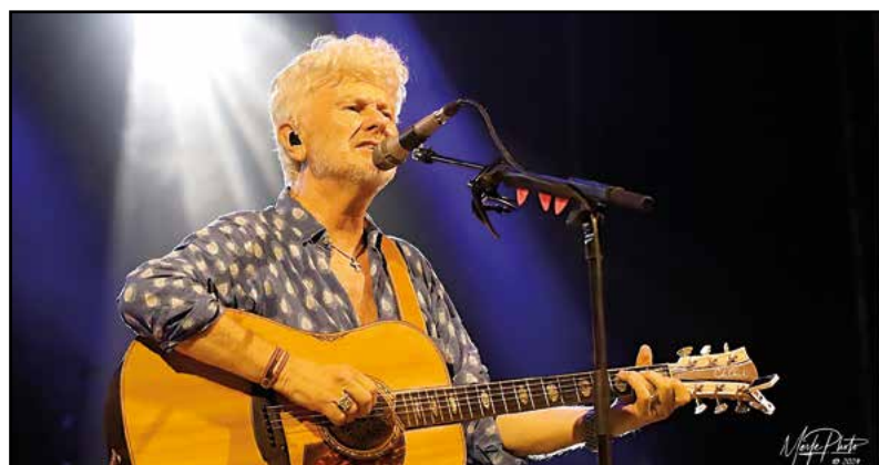
Ron e il romanticismo...