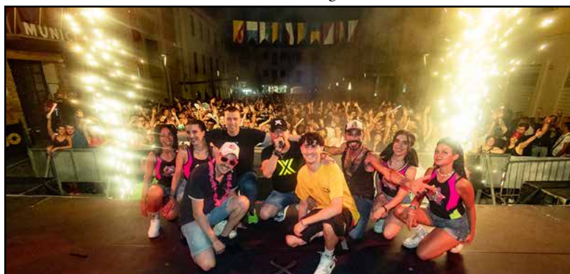
Notte Rosa: una piazza festante...