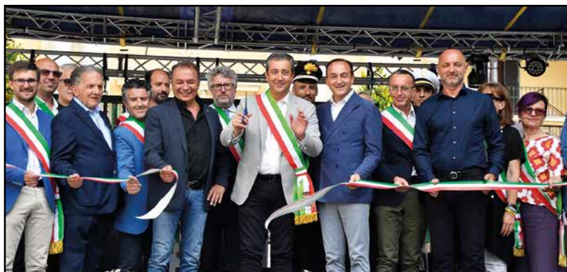
Taglio del Nastro...