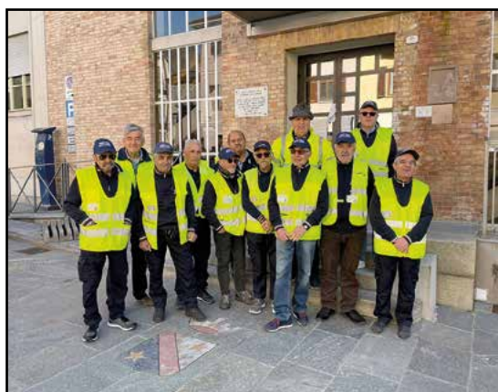
Viva i Nonni