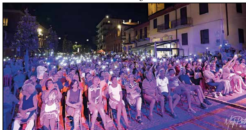
Pienone per le Fontane Danzanti...